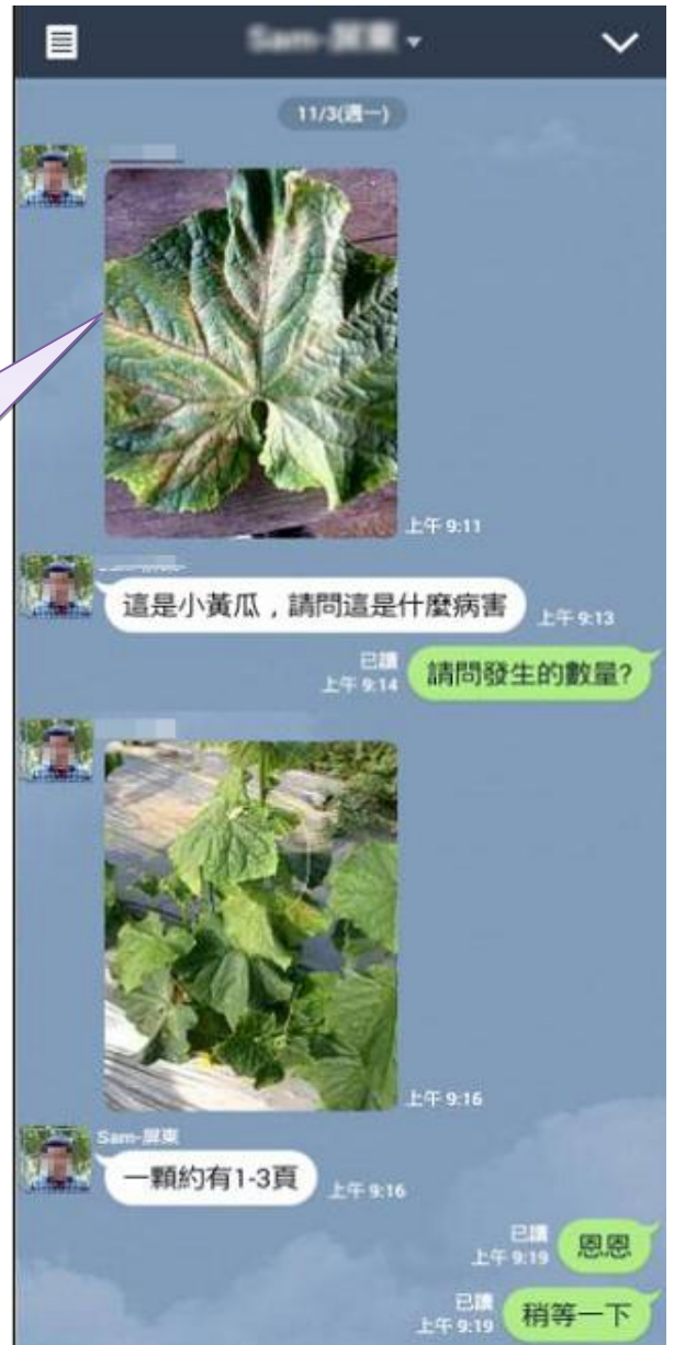
圖 1. 對話相關內容僅供參考

客服小組先對民眾提出問題初步確認，由輪值諮詢專家諮詢，經溝通理解後，再經諮詢小組內部討論結果，才能得到確切答覆。