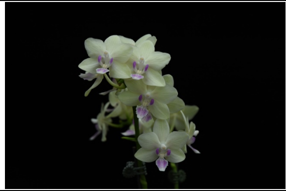
蝴蝶蘭‘桃園 2 號—馨香’花序