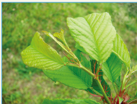
‘桃園 1 號 - 報春’ 黃綠色新葉