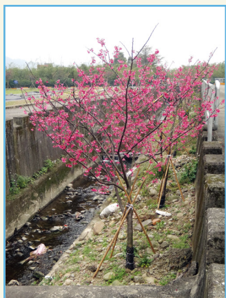
‘桃園 1 號 - 報春’ 全株 (6 年生)

2015 年完成此植物品種權非專屬授權移轉桃園市政府風景管理處，授權金新臺幣 9 萬元整。