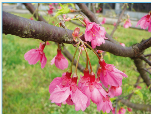
‘桃園 1 號 - 報春’ 繖房花序