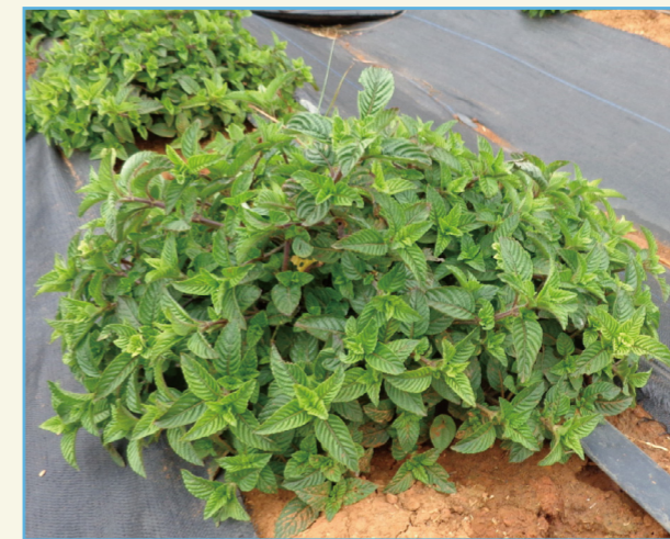
仙草品種桃園 2 號為半直立性株型

本品種半直立株型特性方便收穫，可節省人力成本，適於多次採收型仙草栽培，以提供優質仙草飲品加工材料。仙草新品種桃園 2 號種苗繁殖技術於 2016 年完成非專屬授權移轉桃園市楊梅區農會，授權金新臺幣 5 萬元整。