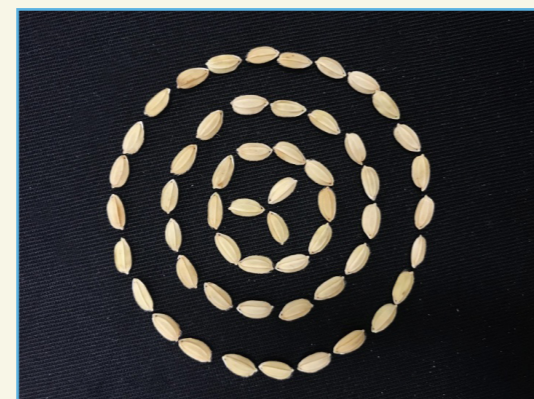
桃園 5 號稻穀照片