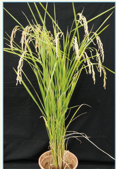
桃園 5 號單株生育情形