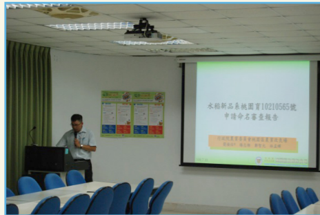
簡副研究員禎佑報告桃園 5 號之命名審查資料