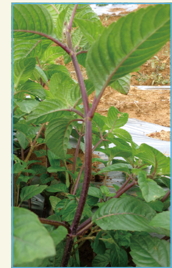
仙草品種桃園 2 號莖呈紫色