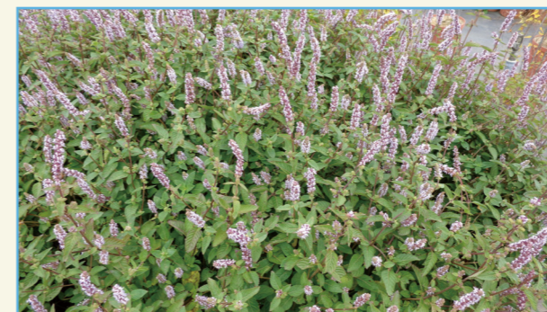
仙草桃園 2 號花