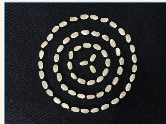
桃園 5 號糙米照片