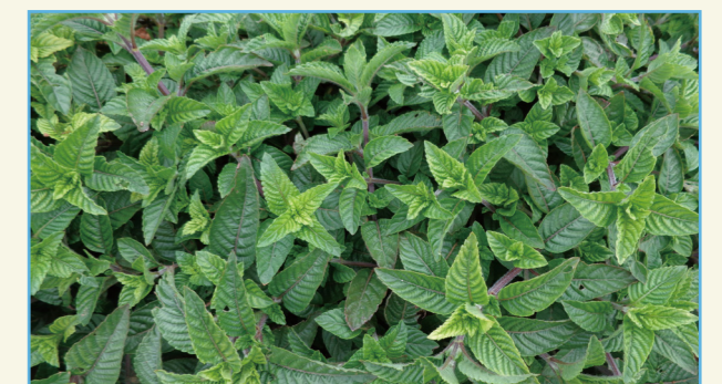
仙草桃園 2 號植株