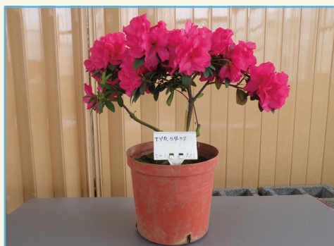
杜鵑花新品種桃園 1 號全株

2014 年完成此植物品種權非專屬授權移轉新北市萬里區花卉產銷班第 1 班，授權金新臺幣 6 萬元整。