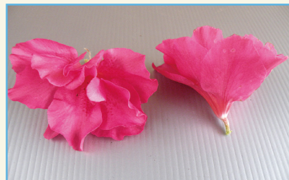
杜鵑花新品種桃園 1 號花朵