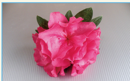
杜鵑花新品種桃園 1 號花朵