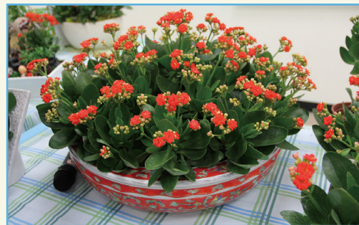
桃園 3 號組合盆栽佈置效果佳