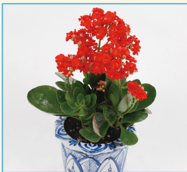
桃園 3 號 - 紅妃植株