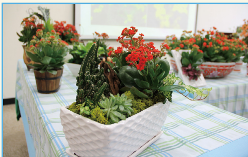
桃園 3 號 - 紅妃組合盆栽喜氣洋溢