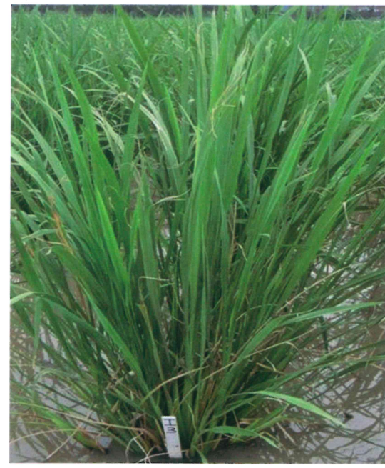
茭白桃園 2 號植株