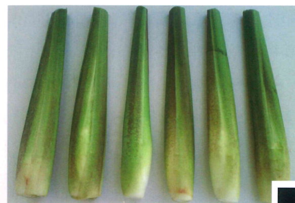
茭白桃園 2 號帶殼嫩筍