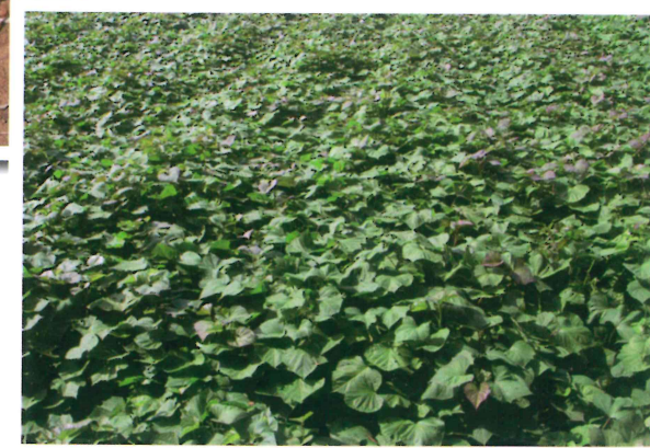
甘藷桃園 3 號之田間生育情形