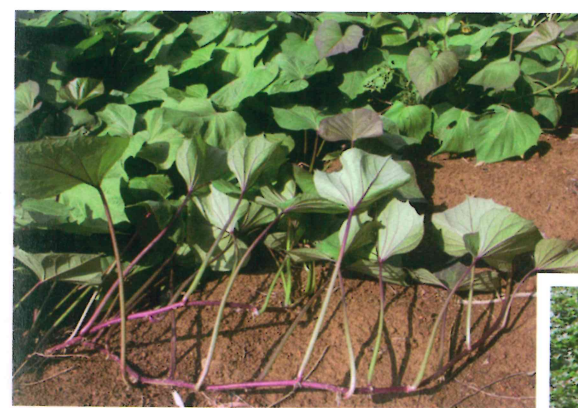
甘藷桃園 3 號之特徵， 莖蔓為紫紅色