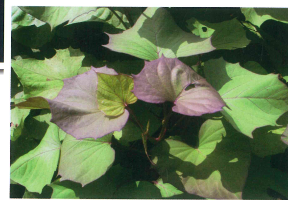
甘藷桃園 3 號之葉形