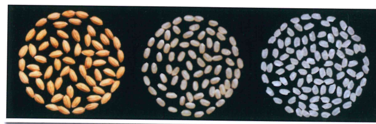
水稻桃園 4 號穀粒(左)，糙米(中)，白米(右)