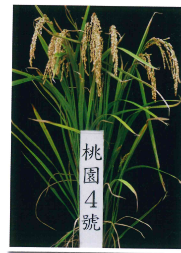
水稻桃園 4 號植株

桃園 4 號生育日數較中晚熟品種短，為避免北部第二期水稻成熟後期因東北季風吹襲及低溫所造成產量減損影響之良好栽培品種，且外觀品質皆佳，但因其穀粒太小，糧商無收購意願，也因此阻礙農民栽種意向。