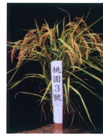
水稻桃園 3 號植株

全台目前皆有種植，栽培面積粗估約有 1,000 公頃，北部主要栽培地區為桃園縣新屋鄉及大園鄉等地，中南部以雲林縣莿桐鄉為主。另已辦理技轉單位計有大園鄉和平育苗材料行、新屋鄉稻米產銷班第八班、新屋鄉農會及楊梅鎮良質米產銷班第七班等四家。