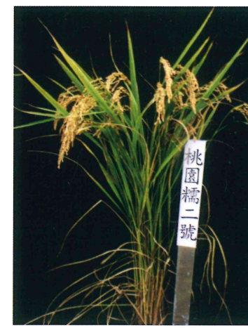
水稻桃園糯 2 號植株