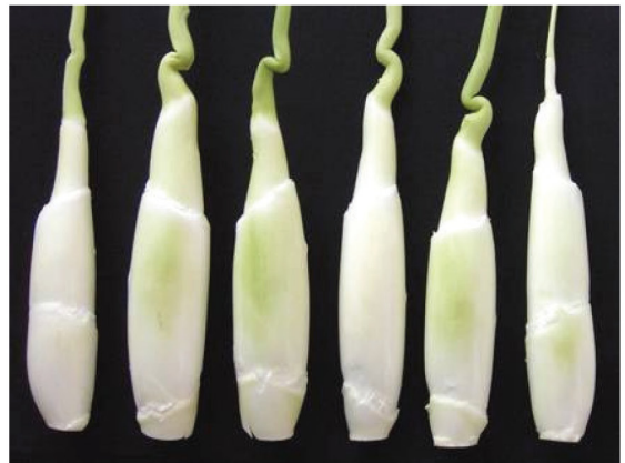
圖 3. 茭白新品種桃園 2 號剝殼嫩筍 Fig. 3. Shelling Shoot of coba new cultivar Taoyuan No.2