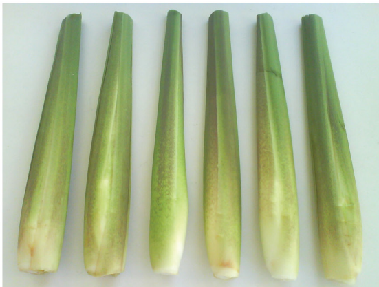
圖 2. 茭白新品種桃園 2 號帶殼嫩筍 Fig. 2. Shoot of coba new cultivar Taoyuan No.2

茭白新品種桃園 2 號（桃園育 02075 號，圖 2、圖 3）屬赤殼種，株型大，葉呈長披針形，綠色而下垂。嫩筍外殼葉鞘呈淡綠色，鞘上帶有許多紅色斑點，嫩筍呈長橢圓形，筍肉黃白色，品質脆嫩，纖維少，筍皮黃白色，筍肉中孢子產生時間晚，黑心率低。北部育苗期常遇低溫，故育苗時間較長約需 45 天，定植至採收約需 187 天，與一般地方赤殼種相類似，盛產期在 10 月中旬至 11 月上旬，栽培時需注意病蟲害防治。