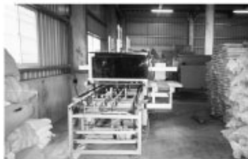
圖2. 安裝於花卉農場之種苗移植機外觀

Fig. 1. Reciprocating transplanting mechanism.