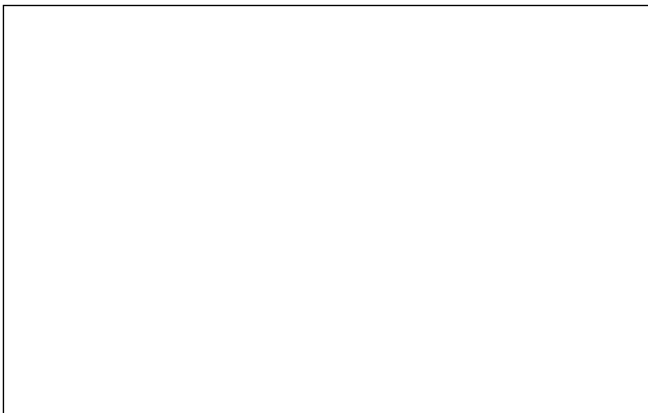
圖 1.荷蘭 Visser 牌 ECOCOMBI 型花卉育苗播種機

Fig 1. The Ecocombi-type sowing machine for ornamental plants made by Visser company of Ntherlands.