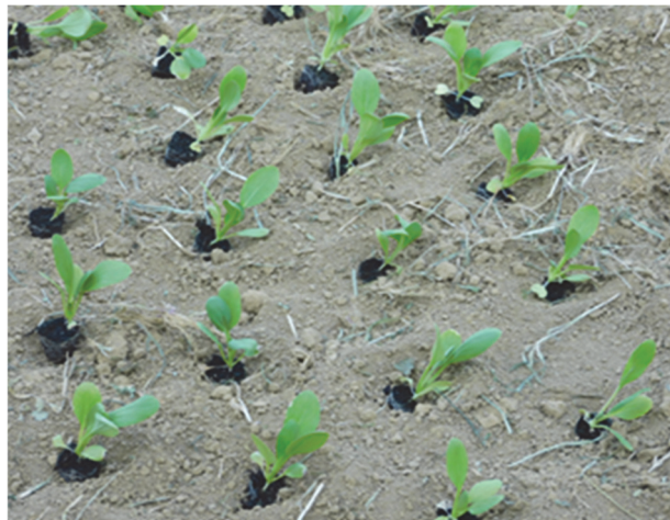
圖 4、實際於田間種植情況

林等人 2023 年研究顯示，燃燒 1L 汽油其碳排放量等同於使用 4.80 kWh 的電力，柴油則係 5.07kWh，並提出電動農機能耗需小於該上述數值始有減碳效益。蘇等人 2013 年研究測試曳引機實際田間整地油耗，結果最大平均耗油量 18.43 (L/h)，最小平均耗油量 4.5 (L/h)，平均耗油量 11.82 \pm 3.6 1 (L/h)，並測試動力插秧機實際田間油耗，結果最大平均耗油量 5.2 (L/h)，最小平均耗油量 2.16(L/h)，平均耗油量 3.39 \pm 0.95 (L/h)。利用上述二研究結果取動力插秧機最小平均耗油量 2.16(L/h)，換算同等碳排放量電力能耗為 10.37 kW，推論電動型動