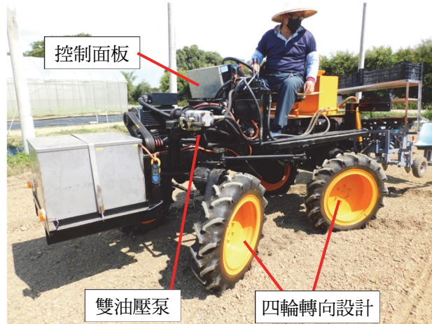
圖 3、實際於田間操作情況

而言，由於整體機身較長，儘管具有四輪轉向設計，仍與大型曳引機具有相似的轉彎半徑，在目前的設施寬度下仍然存在許多操作上的不便。本電動式管理作業機附掛桃園區農業改良場開發的移植機時，在設施內轉彎是困難的。