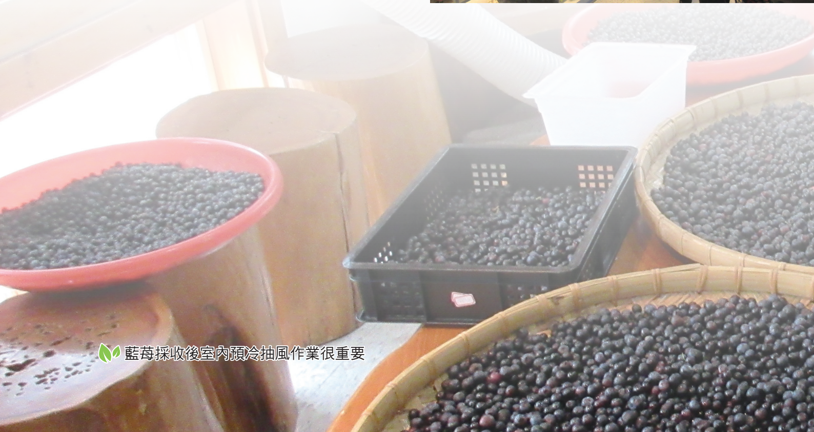
藍莓採收後室內預冷抽風作業很重要