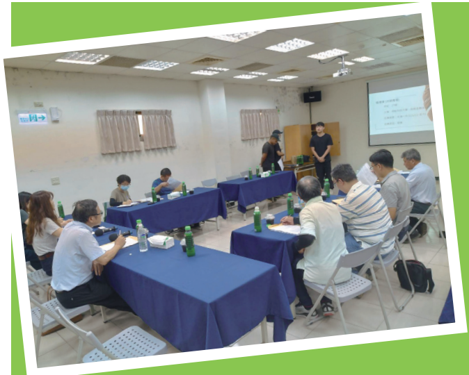
3 位新進青農簡介農場經營的情形

核發該證明予兩位新進青農，並於 7 月份順利加入農保。又經本場多方斡旋與協助下，也讓青農們殷殷期盼的農業貸款得以順利撥付，溫室的擴建計畫才能順利進行。