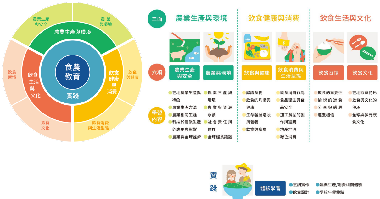
圖 1. 食農教育 (Food and Agricultural Education) 概念架構

「飲食健康與消費」及「飲食生活與文化」三個面向以及六個主題：農業生產與安全、農業與環境、飲食與健康、飲食消費與生活型態、飲食習慣、飲食文化。具體來說，「食農素養」(Food and Agricultural Literacy) 包括了：(一) 具備飲食相關知能及選擇能力，養成良好的飲食習慣，實踐健全的飲食生活。(二) 展現合宜的進餐禮儀、樂於與人分享交流，敏察和接納多元的飲食文化 並傳承在地飲食文化。(三) 瞭解各種農業活動、關懷自然與環境，覺察農業與經濟、社會、環境的關聯與價值，支持在地農業與永續發展。