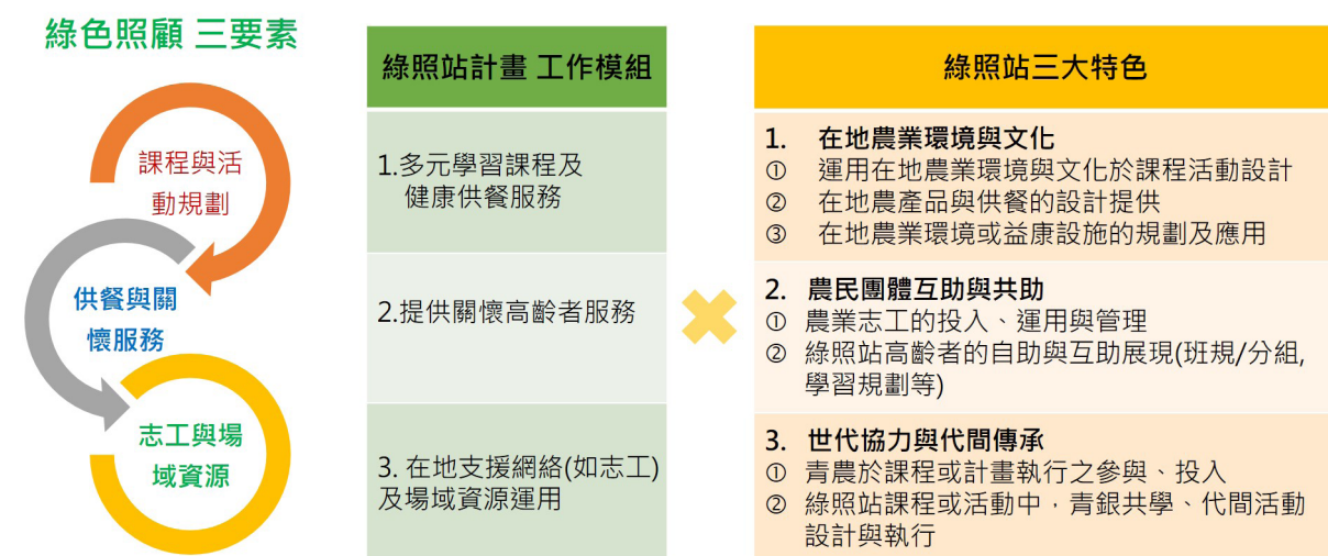
圖 3. 農業推廣體系之綠色照顧站規劃與經營

「綠色照顧」計畫的主要工作項目包括三大項：（一）多元學習活動：鼓勵結合在地農業特色及自環境，以長輩為師或是結合青農，促進青銀共學、世代交流，傳承地方文化記憶。（二）互助共食：運用當季的在地食材與供餐服務，並結合國民健康署社區營養中心的資源，推動高齡友善飲食：「我的餐盤」、「三好一巧」等，將高齡者飲食營養與牙口需求納入設計考量，讓高齡長者食用新鮮食物攝取充足營養。同時，透過共餐體驗也是推動高齡者「食農教育」的一環。（三）高齡者關懷服務：結合志工力量，以定點及訪問方式提供高齡者健康等相關資訊及關懷服務，並積極鼓勵高齡者加入綠色照顧站、參與社會。在計畫推動上，各地農會利用過去存放農糧的倉庫等閒置空間進行改造，設立農會「綠色照顧站」，結合在地農業與地方文化特色，辦理多元學習課程、健康共餐，也集結家政班成員、志工組織，提供關懷服務、建構在地的高齡照顧支持網絡。自 2020 年開辦至今，2023 年已有 121 家農漁會辦理「綠色照顧」計畫，以全國共 342 家農漁會（302 家農會、40 家漁會）來看，普及率達 35%。