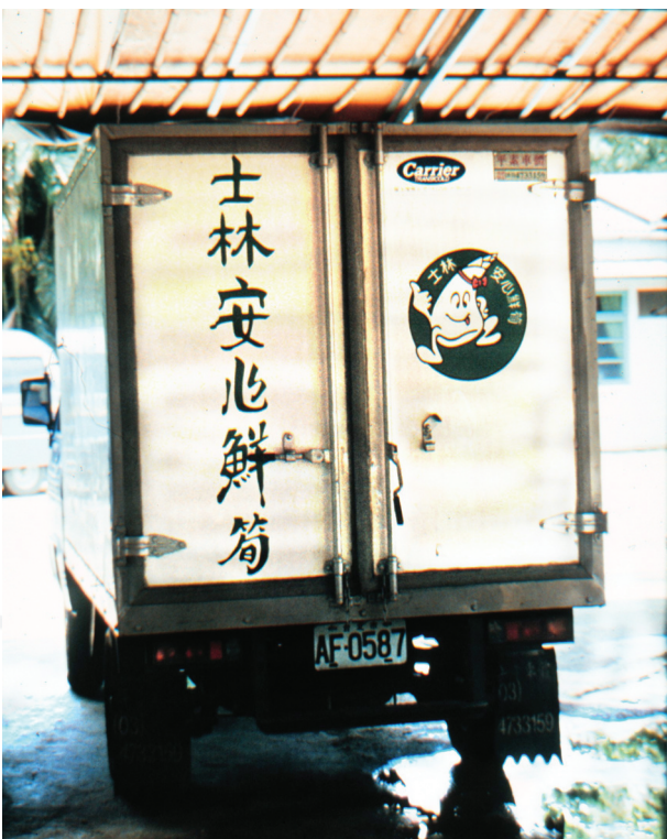
圖6. 安心鮮筍低溫輸送車