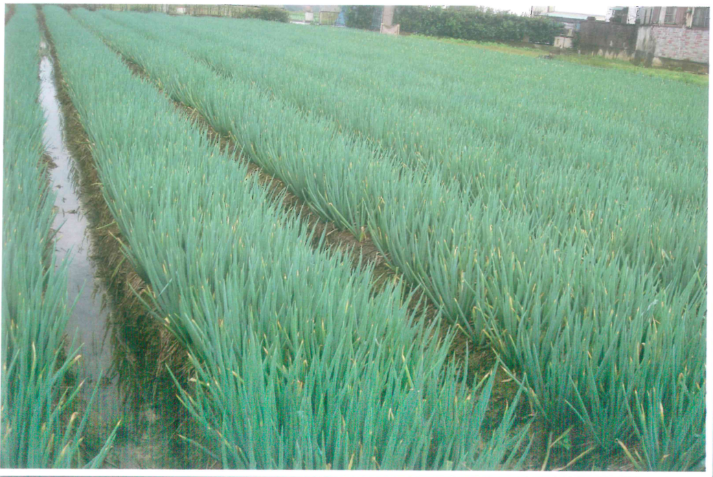
青蔥桃園 4 號田間生育情形