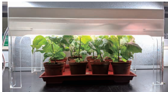
▲圖 1. 冷陰極螢光植物生長燈 (L6 光譜) 栽培紫蘇情形。

技實業有限公司」。有興趣技轉本項技術者，可洽本場劉廣泉副研究員；欲洽購商品化產品者，請洽羽安公司李總經理 (0938-494313)。