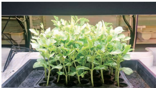
▲圖 2. 冷陰極螢光植物生長燈 (D 光譜) 栽培瓜類嫁接苗情形。