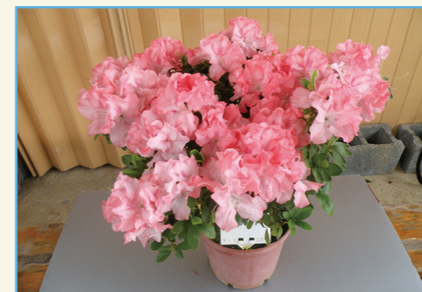
杜鵑花新品種桃園 2 號全株

2014 年完成此植物品種權非專屬授權移轉新北市萬里區花卉產銷班第 1 班，授權金新臺幣 6 萬元整。