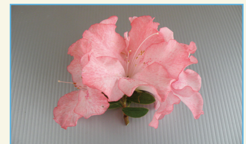
杜鵑花新品種桃園 2 號花朵