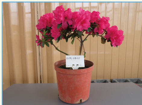
杜鵑花新品種桃園 1 號全株

2014 年完成此植物品種權非專屬授權移轉新北市萬里區花卉產銷班第 1 班，授權金新臺幣 6 萬元整。