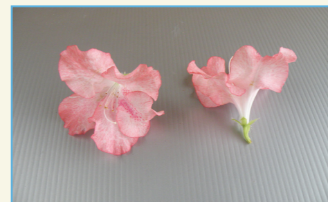
杜鵑花新品種桃園 2 號花朵