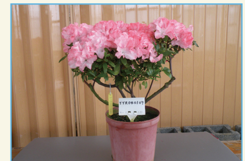
杜鵑花新品種桃園 2 號全株