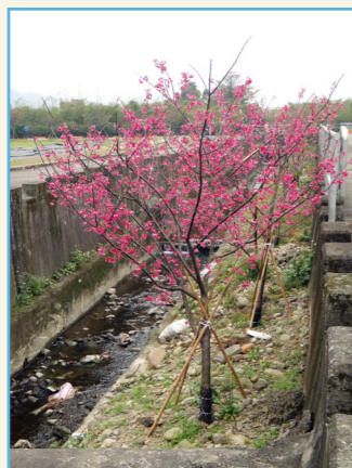
‘桃園 1 號 - 報春’ 全株 (6 年生)

2015 年完成此植物品種權非專屬授權移轉桃園市政府風景管理處，授權金新臺幣 9 萬元整。