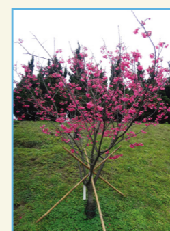
‘桃園 2 號 - 紅梅’ 全株 (7 年生)

桃園區農業改良場為能選育都市景觀利用的櫻花品種，以臺灣山櫻花為親本所選育出適應低海拔地區生育之新品種。樹型傘型，花形較原生山櫻花開張，花徑大、花色艷紅、開花多而整齊，生長勢中等，適應臺灣北部都市氣候，極適用庭園景觀苗木利用。新品種以非專屬授權種苗生產販售，授權金為新臺幣 9 萬元整，授權期限 5 年，授權地區限臺灣地區。