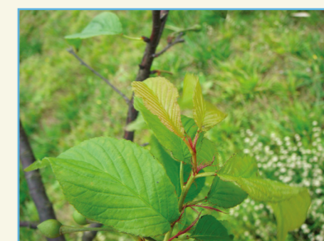
‘桃園 2 號 - 紅梅’ 黃綠色新葉