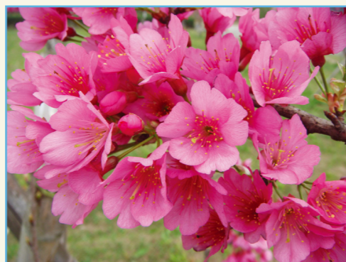
‘桃園 1 號 - 報春’ 紅紫色花朵