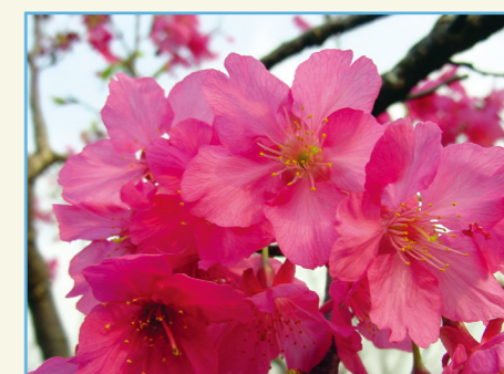
‘桃園 2 號 - 紅梅’ 紅紫色花朵