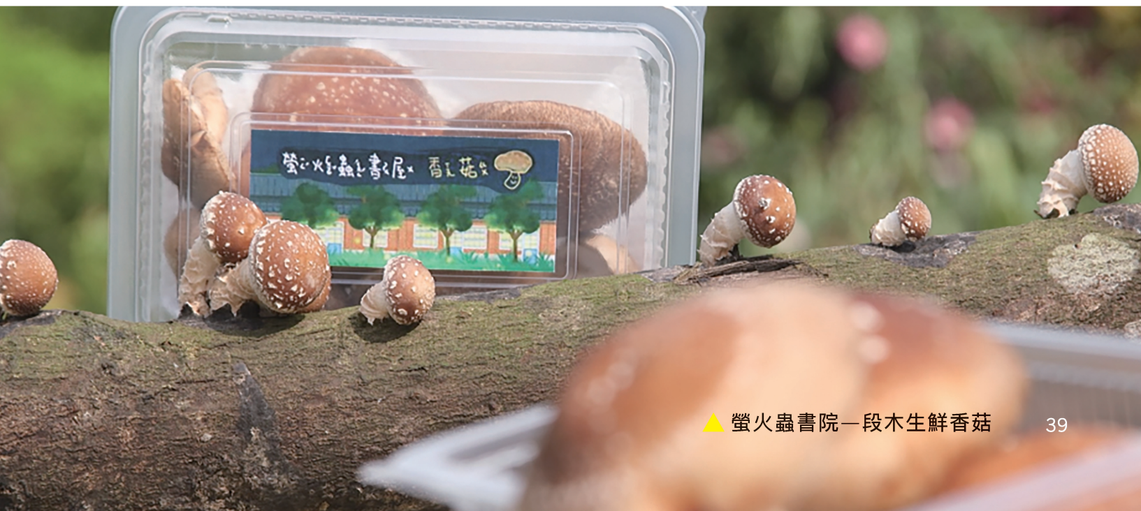
▲ 螢火蟲書院一段木生鮮香菇