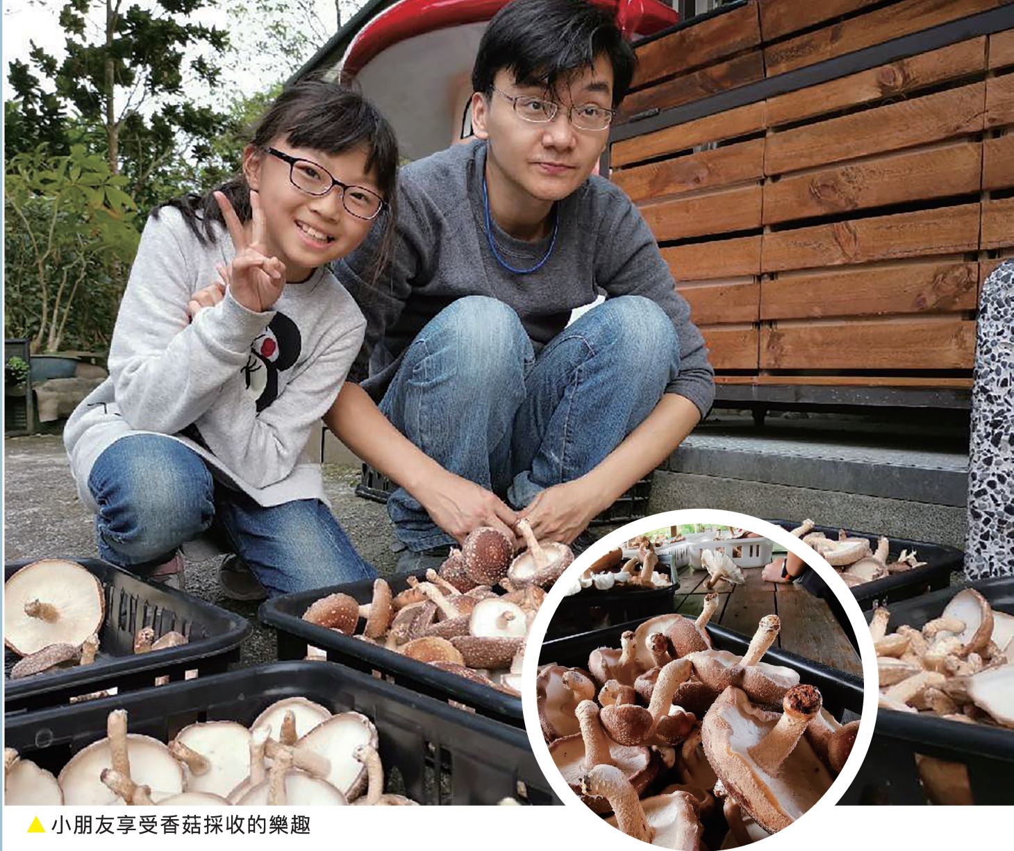
▲小朋友享受香菇採收的樂趣