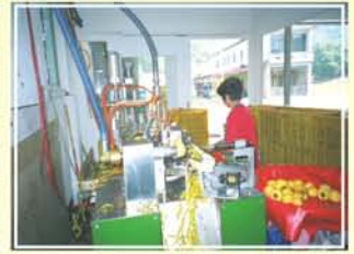
●圖8. 橫向吸附固定削皮機作業情形。