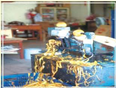
●圖1.傳統柿子加工削皮機作業情形。

設於柿子吸附上昇裝置後續位置，具有一可升降及水平方向移動之基座，該基座兩端設有氣壓式夾果裝置，藉由夾爪可夾取經削梗、修蒂與蒂邊緣削皮之果子，並依基座之升降、移動調整變換位置，本項機構可作180°迴轉轉換(圖7)。