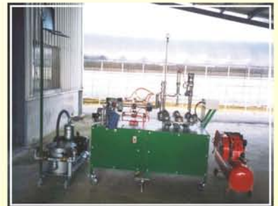
●圖3.柿子加工削梗修蒂與削皮一貫作業機全貌。