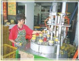
●圖5. 柿子加工削梗修蒂與削皮機進料定位作業情形。