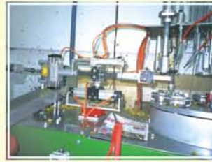
●圖7. 氣壓式夾果橫移轉向機構作業情形。