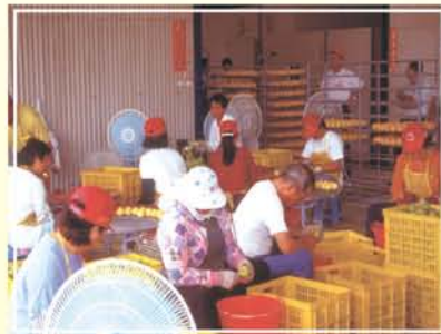
●圖2.人工削梗與修蒂作業情形。