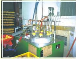
●圖6. 柿子削梗、修蒂、果肩、果頂削皮及附上昇等一貫化作業情形。