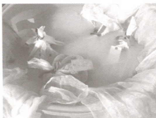
圖4 利用50%撲克拉錳可溼性粉劑1000ppm消毒種球

長至花苞階段(圖6)，若再增長貯藏時間，則種球有萎縮現象、部分花苞會消蕾或失去觀賞價值。