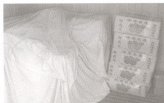
圖5 置5°C冷藏庫貯藏2個月後，有利於開花整齊。