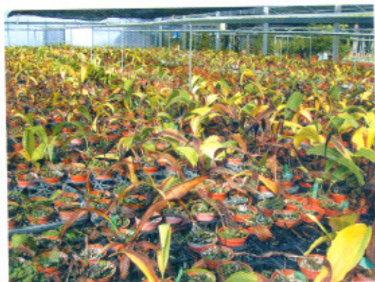
圖2 以葉片枯黃或脫落為採收適期，一般約在11月下旬左右。