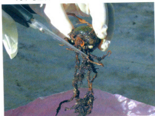
圖3 剪根時需避免傷及花芽