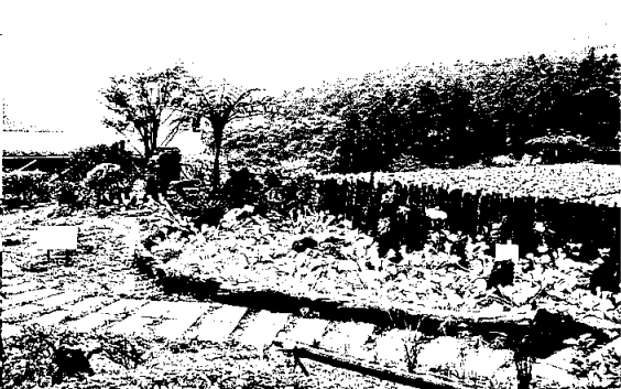
▲ 花藝造型設計第二名：雲海