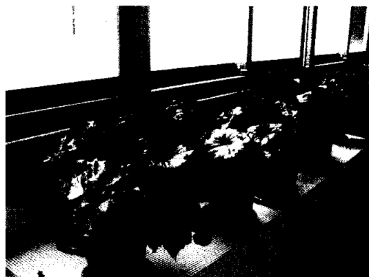
▲麗格秋海棠在室內高光強度下，開花壽命長及觀賞品質最佳。