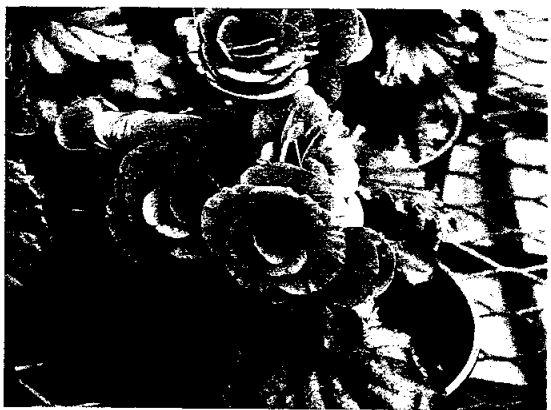
▲直立型之麗格秋海棠。