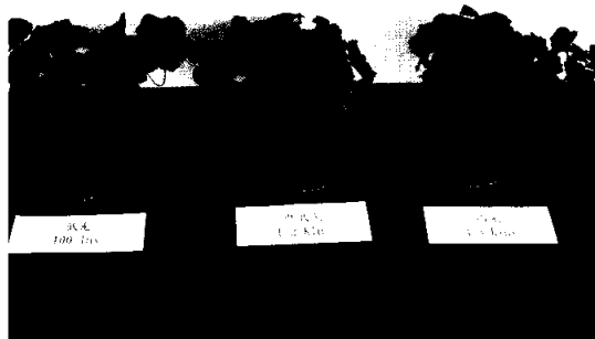
▲麗格秋海棠盆栽置於不同光度區中20天，對盆栽開花品質之影響。

由上可知欲得好的麗格秋海棠盆栽觀賞壽命及開花品質，首先盆花出貨成熟度須達開花數二分之一以上，再配合消費者具有中高光強度的居家環境，及適當的水管理，即可以得到開花期長、花色鮮豔、開花數多觀賞品質佳及觀賞壽命長的盆花。 ■