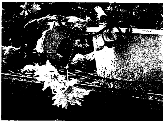
▲下垂型之麗格秋海棠。

為枝條下垂型多用於吊盆，另一類直立型以盆花栽培為主，台灣生產以此類為主。麗格秋海棠因花色鮮豔、花形富麗典雅，是北台灣地區春夏季重要的盆花之一。