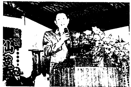
▲黃場長有才在開幕中致詞