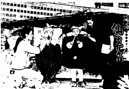
▲小仙童選拔是活動中最有趣的項目