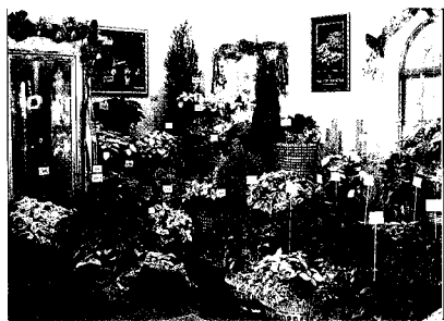
▲ 目前在台灣聖誕紅的品種已有49種，圖中為本場於去年底在三峽分場舉辦花展時的品種展示。

有權，經登記後，他人未取得授權而擅自推廣或販售者，處二年以下有期徒刑、拘役或科或併科二萬元以下罰金，若擅自使用新品種者，處六個月以下有期徒刑、拘役或科或併科五千元以下罰金，前二項之罪行為告訴乃論。權利登記之申請必須與命名登記同時申請，未同時