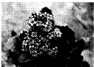
▲ 長壽花於去年公告適用種苗法。

但也有一些新品種經命名登記後不予權利登記：1.一般糧食作物的新品種，因為這是民生必須物，為穩定市場的供應，如果開放權利登記可能會出現市場壟斷或價格哄抬的情形發生；2.申請命名登記前已推廣、銷售之新品種。而未經核准命名登記之新品種，不得推廣及銷售，違反者處一萬元以上五萬元以下罰鍰，並可沒收其種苗。但在公告之前就已推廣、銷售者，即流通品種，在公告後則仍可推廣及銷售，即表示種苗法不溯及既往。目