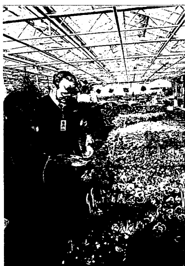
▲ 國外知名種苗公司之一 Goldsmith 認為育種家是科學家也是藝術家，希望在調色盤上大筆一揮就能培育出理想顏色的品種。

，爲了讓育種家的辛苦能有所回應，進而鼓勵育種家培育出更多的新品種，國際間成立了一個植物新品種的保護協會（International Union for Protection of New Varieties of Plants，簡稱UPOV，總會位於瑞士）並明立法條，目的即在保護育種者及新品種的權利，目前接受保護的植物種類近200種。我國亦於民國77年公布植物種苗保護法，正式立法保障新品種的權益，本法第一條即開宗明義的說「爲實施植物種苗管理，保護新品種之權利，促進品種改良，以利農