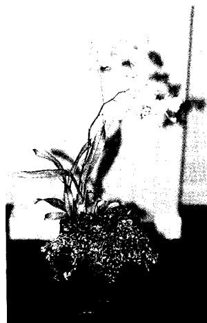
▲ 有時組合盆栽的植栽無須要多，只要能與容器搭配合宜，二三棵植物也能有美的表現。

近幾年來，組合盆栽於台灣的濫觴，可謂百家齊放，然此項產品尤重如何發揮植物的配植技術，表現創意與園藝樂趣，是兼具實用及觀賞價值，結合美感，自用送禮，超感官的作品，因此對植物素材之選擇，配件之得宜搭置，皆須多加練習嘗試，方能享受箇中樂趣。 ■