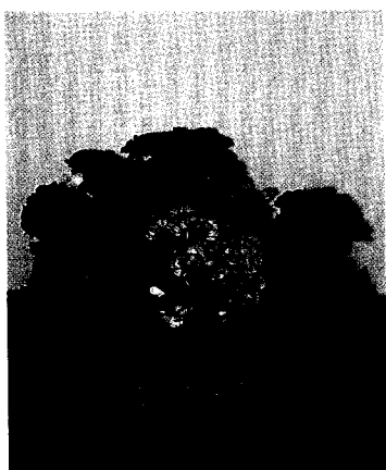
◀ 麗格海棠是很好的室內觀花植物，圖中為在室內放了三個星期。

故於創作組合盆栽時，須依使用機能予以規劃，如屬藝術面之創作僅考量植物質感色彩線條等條件，其觀賞價值或可取向製造衝突或對比之美感，但至少需選取對光照需求度較統