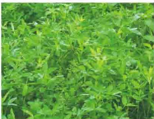
豆科綠肥－埃及三葉草