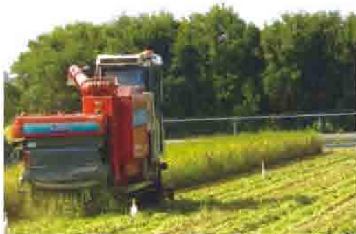
收割時稻草切割後掩施可增進土壤肥力