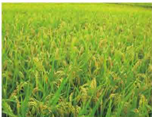
適宜的土壤及施肥管理是生產良質米的必備條件