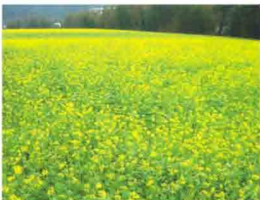
十字花科綠肥－油菜