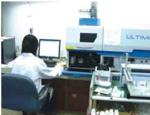
水稻田土壤應2-3年採樣分析一次，作為施肥推薦之依據