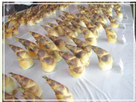
●圖6.綠竹筍外觀呈牛角型、色澤均勻者為優級品。

產筍期於接近尾聲的9月至10月(白露後至寒露前)，為留存翌年產筍母竹的時期，此時讓竹筍長成竹桿後，選生長勢強且健壯之母竹予以留存，每叢留存的母竹數約2~3組(每組包括3年生竹桿1支、2年生竹桿1~2支)即可。