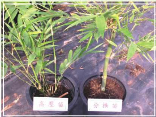
●圖4.綠竹高壓苗與分株苗假植盆中生長情形。