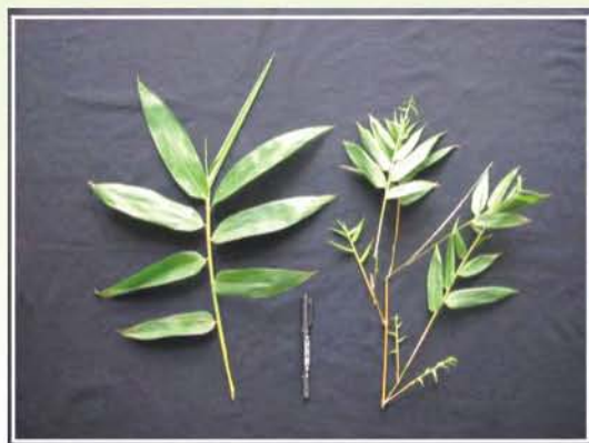
●圖7. 綠竹將開花前會有新生葉片變小、枝條分支數變多的徵兆(右側)。

竹類絕大多數是多年生一次開花植物，亦即竹開花後植株將走向死亡，綠竹也是如此。綠竹即將開花前，會有新生葉片短小及枝條分支數變多等徵兆(圖7)，此徵兆出現後約1~2個月會開始開花，竹株開花後約1年半至2年會乾枯死亡，因此綠竹開花目前僅有移除竹株一途。綠竹開花顯示植株生理已達成熟階段，環境逆境如乾旱或淹水、病蟲害、營養缺乏或過度清除竹頭等均可能導致綠竹開花，但綠竹開花的真正原因眾說紛紜迄今尚未完全明瞭。