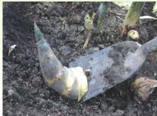
●圖5.採筍位置為筍基部最寬處上方1至2公分處。

綠竹筍產期為每年5月至10月，6月及8月為兩個產筍高峰，6月的高峰期又稱正筍期；8月的高峰則稱秋仔筍。採筍通常於清晨開始進行，出筍位置可由竹桿節位上枝條生長的方向、土面有否裂開或有無露水沾濕等情形判斷，找到出筍處後，先以筍刀或鋤頭將竹筍旁覆土撥開至可見整支筍，自竹筍基部最寬處上方1~2公分處下刀切筍(圖5)，切口要平整，以避免採筍後留存之竹頭腐爛，切筍的位置很重要，切太嫩收穫量少，切太老則不能食用部份多，且會傷害基部筍芽，減少二次筍的產量。一般下刀後應先取