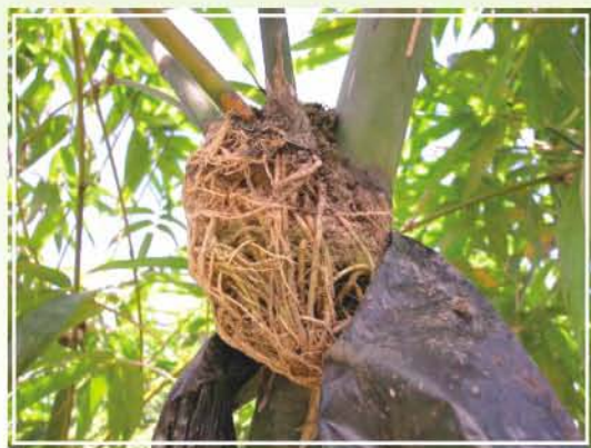
●圖3.綠竹高壓繁殖發根情形。