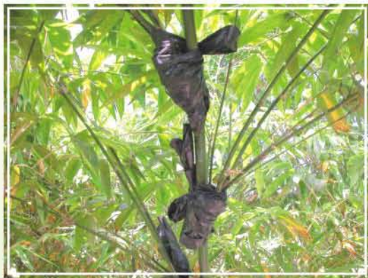
●圖2.綠竹高壓繁殖法。

此法之優點是竹苗的繁殖倍率較分株法高，目前推廣無病毒綠竹苗時，多採用本法繁殖種苗。綠竹枝條基部極易發生鬚根，利用約250公克濕水苔，以長50公分、寬20公分的長形黑色塑膠布包覆在枝條基部，不須使用發根劑，即能誘發鬚根生長(圖2、3)。此鬚根的誘發與溫度成正比的關係，而與高壓竹桿的粗細無關，即氣溫愈高，鬚根之生長也愈好，不會因竹桿粗細的差別而影響鬚根之生長，5月至9月進行高壓處理最佳，高壓1個月後，平均發根率可達51%以上，若高壓時間延長達半年，則發根率接近100%。高壓前除去枝葉，或選竹桿較下部的節位高壓，均可促進鬚根的生