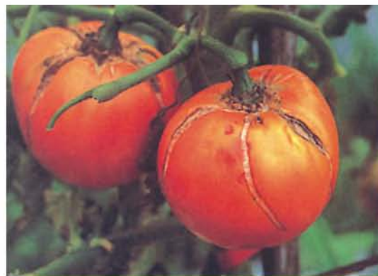
●土壤水分過分劇烈變化造成番茄裂果(成熟果)