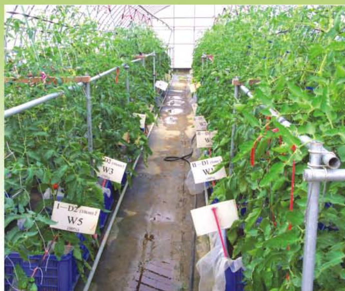
●設施網室籃耕番茄

意水分適時適量的供應，以維持適宜的土壤水分含量，或採植畦覆蓋塑膠布方式栽培，減少土壤水分蒸發。