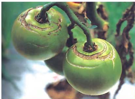
●土壤水分過分劇烈變化造成番茄裂果(中果期)

籃耕栽培番茄水管理是植株生育良好與否的重要關鍵，籃耕栽培容器排水性佳及蒸發量大，較少有栽培介質水分過量情形，但仍應注意水分的適量供應，隨時保持介質濕潤狀態，勿使栽培介質水分含量過分劇烈變化，以免造成番茄缺鈣果及裂果的發生。