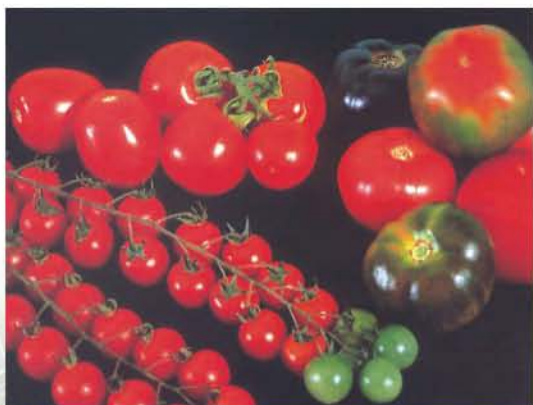
●合理施肥及水管理是生產高品質番茄的必備條件