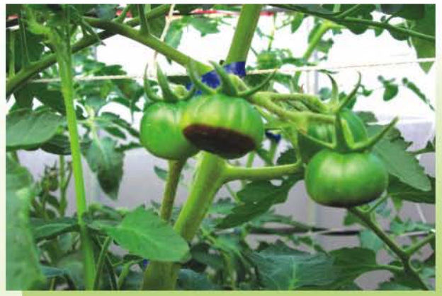
● 鈣元素及水分不足是缺鈣果發生的主要原因

穀殼：椰纖+米糠=1：1：1+10%發酵腐熟堆肥為栽培介質者；定植前一天將栽培籃中之介質澆水至完全濕潤，定植後僅滴灌清水，約2~3天滴灌1次。2週後開始滴灌養液，養液配方為尿素100公克、硝酸鈣400公克、硝酸鉀200公克、磷酸一鉀100公克、硫酸鎂150公克及微量元素或海草精30公克溶於1公噸水中，每天滴灌2次，每次滴灌至栽培介質濕潤為止。開花後養液配方改為尿素200公克、硝酸鈣500公克、硝酸鉀280公克、磷酸一鉀200公克、硫酸鎂200公克及微量元素或海草精40公克，每天滴灌2~3次，每次滴灌至栽培介質濕潤為止。栽培介質擬於次季再使用時，採收結束前10天左右應停止養液供應，改以清水滴灌，可減少栽培介質鹽類累積