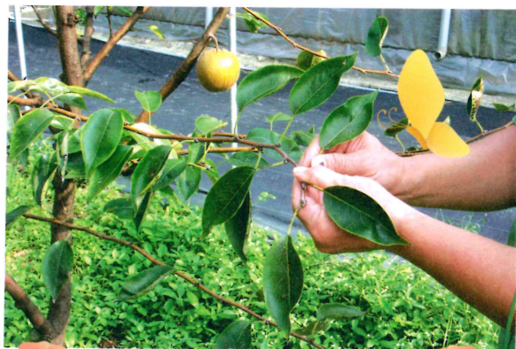
果樹植體(葉片) 採樣