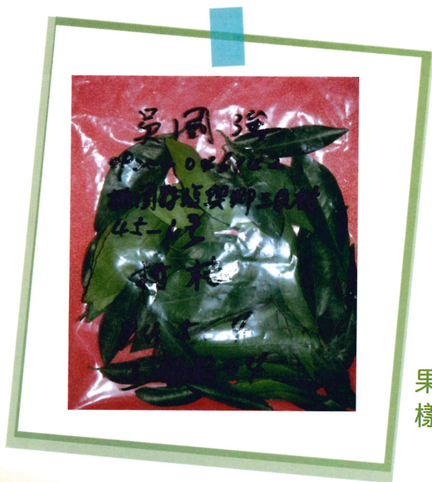
果樹植體(葉片) 樣品標示