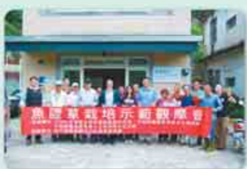
↑本場傳副場長仰人(前排左5)與農友及社區居民於會場合影。

藉由本場栽培示範範圍的建立，期許未來能透過點(本場栽培示範園)與點(社區栽培園)之間的連接，擴大為整體的產業面，使魚腥草產業能在關西地區生根、茁壯。