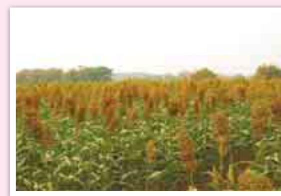
↑新竹縣新豐鄉復耕農田種植釀酒高粱結實情形。

本場LINE作物病蟲害即時診斷服務，服務時間週一至週五上午8時至12時，下午1時至5時，歡迎農友多加利用