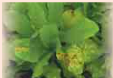
↑萵苣-露菌病危害形成角斑狀病斑，上有粉狀孢子。