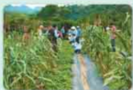
魚腥草喜陰涼潮濕環境，主要生長於海拔2,000

玉山社區農作栽培以柑橘類果樹為大宗，面積約15公頃，因生育期長且多以慣行農法栽培，缺乏特色，產品售價不高，在考量社區意願、栽培條件(勞動力不足、缺乏農業機械及生產設施)及魚腥草全株具特殊氣味少有病、蟲危害且對環境適應性強等特性，輔導社區建立魚腥草有機栽培模式，滿足商業生產需求。