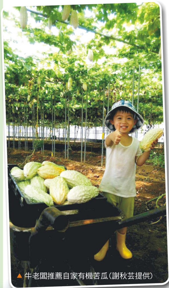
▲牛老闆推薦自家有機苦瓜