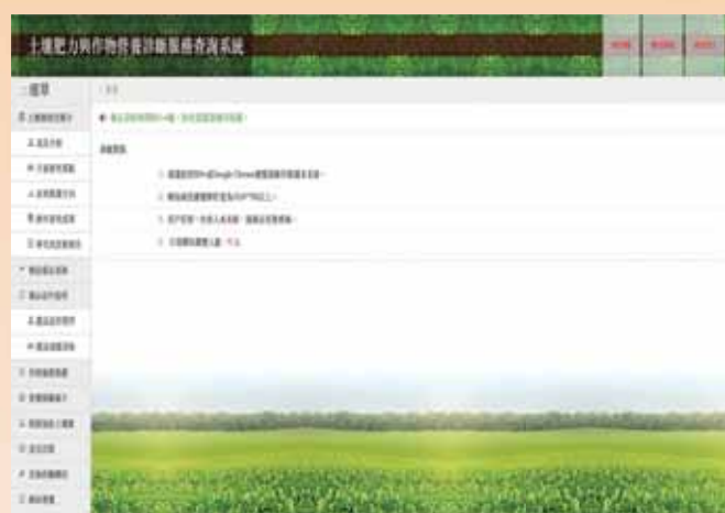
樣品分析報告查詢專屬網頁