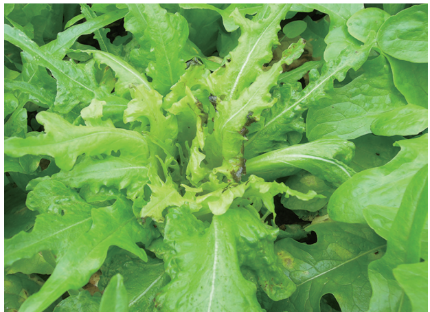
萵苣白尾紅火蚜危害造成心葉萎縮褐化

蚜蟲類害蟲為雜食性，葉菜類寄主有十字花科蔬菜、菊科、蕓菜、芹菜、菠菜、羅勒、莧菜及龍葵等。以刺吸式口器吸取植物汁液，造成心葉萎縮，嫩葉縮小畸形，葉片皺縮變黃，花苞花瓣有點刻狀的褐色斑痕或變色等現象。刺吸植株後由尾部蜜管分泌蜜露於植株上，可誘發煤煙病真菌寄生，影響植物光合作用，使植株衰弱，甚至枯死。除直接為害外，大多數蚜蟲為傳播植物病毒之媒介昆蟲。蚜蟲體型小，喜群棲於嫩芽，花苞、葉背等較隱密的部位。其生活史複雜，可產生有翅型蚜蟲飛行尋找適合寄主，可行世代交替及孤雌生殖，當食物充足，氣候條件適合繁殖時，蚜蟲以無性胎生繁殖，短時間產下大量雌性個體，造成重大危害。