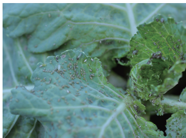
菜蚜危害十字花科作物