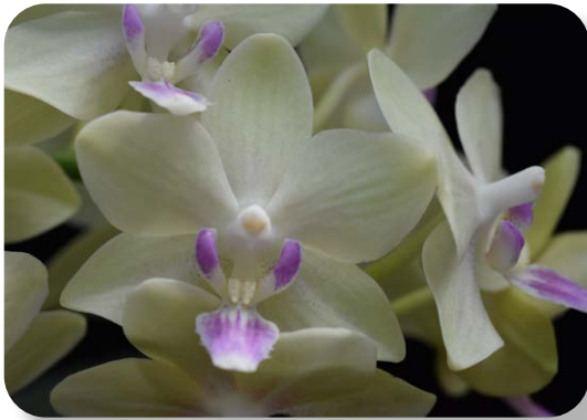
蝴蝶蘭新品種 ‘桃園 2 號 - 馨香’ 花朵

蝴蝶蘭 ‘桃園 2 號 - 馨香’ 為小花，花徑約 4 公分，花梗數 1 至 2 梗，單梗有 1 至 3 分支，每株可開 20-30 朵花，株高約 30-40 公分，花色為比較少見的黃綠色系，唇瓣帶線條淺紫紅色，與淡綠黃色花瓣有清晰的對比，小巧可愛且香氣芬芳，具有清香素雅特色，適合室內空間擺設，營造溫馨的環境。