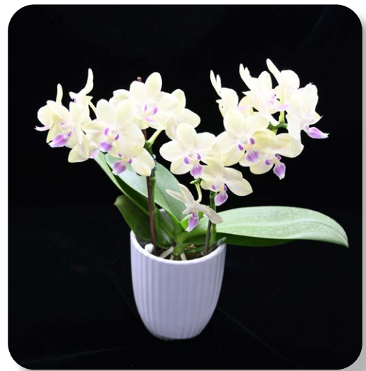
蝴蝶蘭新品種 ‘桃園 2 號 - 馨香’ 植株外觀