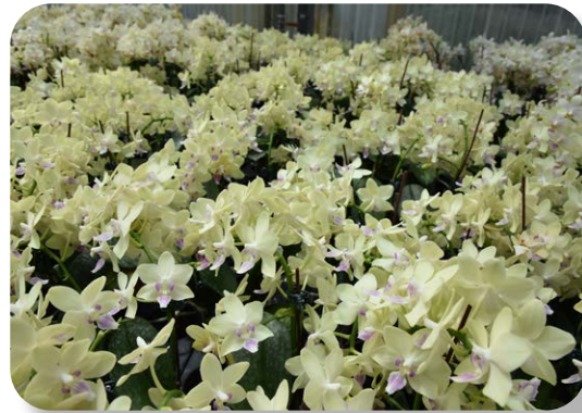
蝴蝶蘭新品種 ‘桃園 2 號 - 馨香’ 田間開花情形