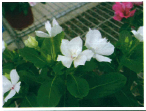
日日春桃園 4 號-夏雪花朵近照