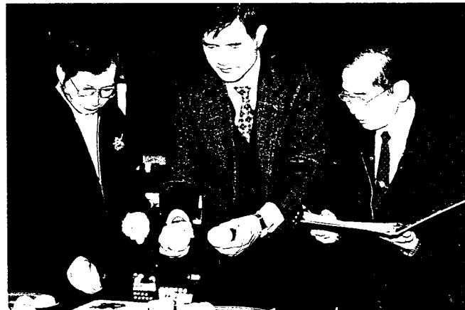
▲ 評審海梨柑果皮厚度及種子數量