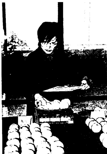
◀ 秤量果實重量並計算果肉比率

評鑑資料顯示，今年海梨柑果品的優點是水分充足，外觀好，糖度高，比去年提高1-2度，為什麼有此好成果？據說除了氣候適宜之外，施用有機肥料也是一個重要原因。