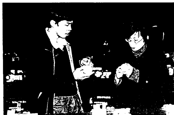
▲ 農民請教栽培管理要點