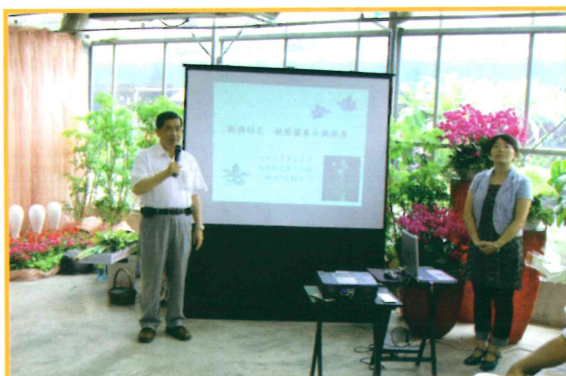
2010年7月10日新興切花-根節蘭記者會