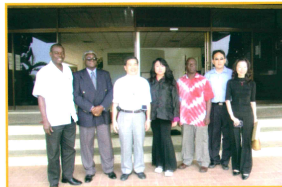
2006年9月20日接待迦納外賓參 訪