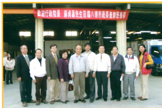
2007年2月4日蘇院長貞昌與八德市蔬菜產銷班第3班合影