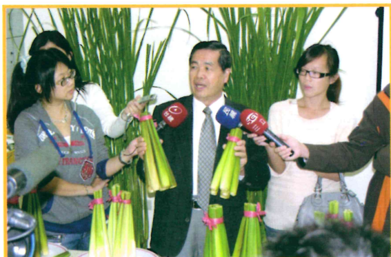
2010年11月9日茭白新品種記者會