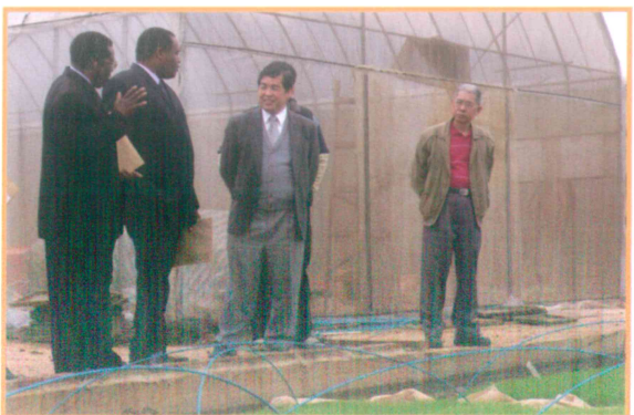
2005年2月2日接待馬拉威農業部長參訪