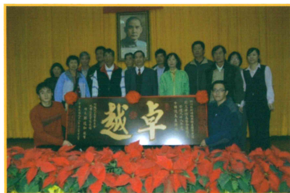
頒贈賀匾予 2009 年全國優良產銷班得獎者新埔鎮果樹產銷班第 21 班