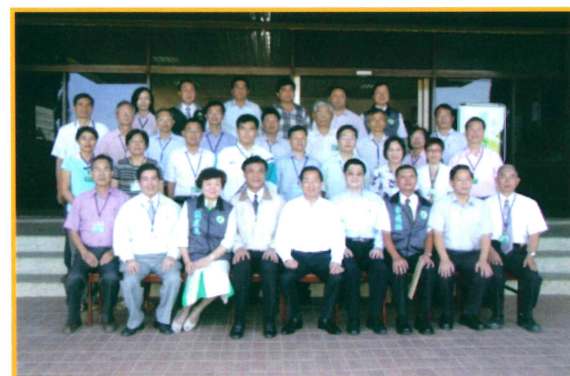
2006年10月26日陳總統水扁與本場同仁合影