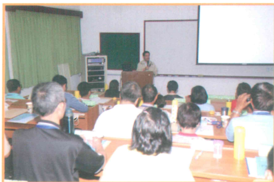
2009 年農民專業訓練堆肥製作班上課情形