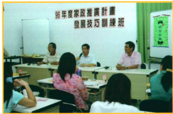
2007 年家政推廣計畫發展技巧訓練班