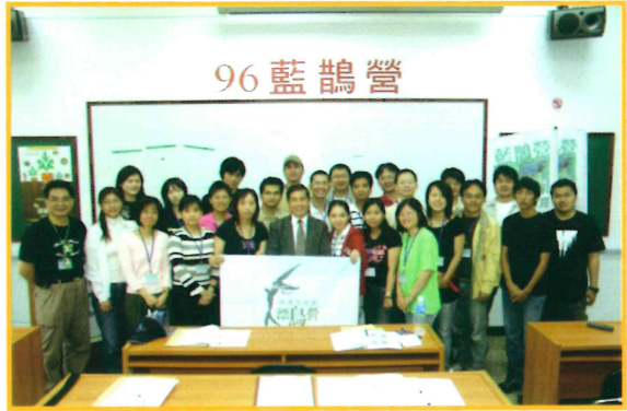
2007 年鄭場長與漂鳥藍鵲營第五梯次學員合影