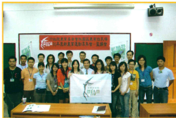
2006 年鄭場長與漂鳥學員合照