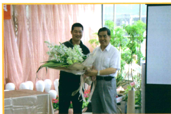
2010年7月10日新興切花-根節蘭記者會