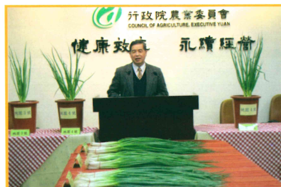
2009年12月7日召開青蔥記者會