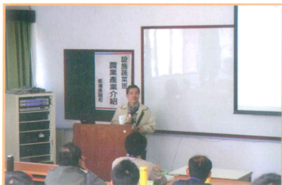
2010 年農業職業訓練設施蔬菜班上課情形