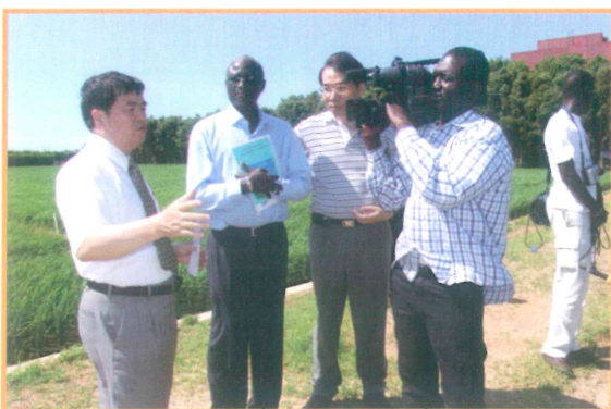
2005年5月17日接待塞內加爾外賓參訪