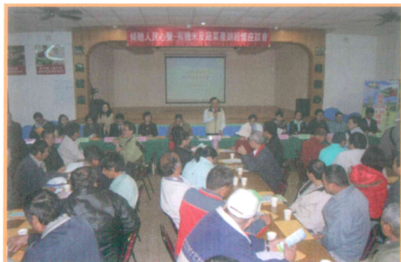
2010 年於新屋鄉召開傾聽人民心聲-有機米及蔬菜產銷座談會