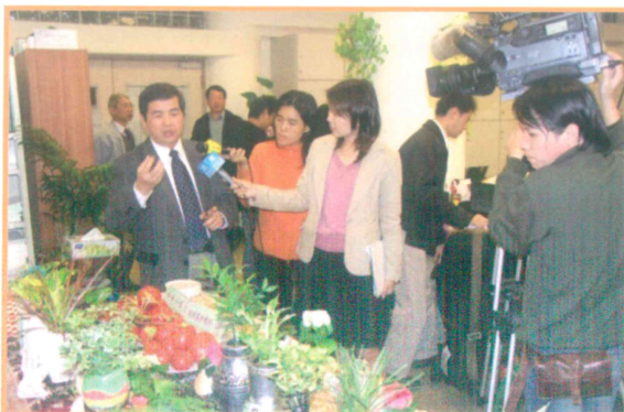
2004年12月8日介紹本場研發新技術及產品記者會