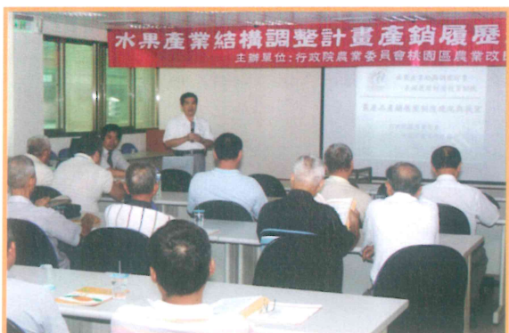
2007 年水果產業結構調整計畫產銷履歷座談會