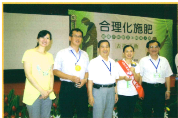
2010 年合理化施肥績優示範農友及輔導人員表揚活動