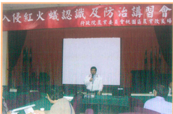
2004 年入侵紅火蟻認識及防治講習會