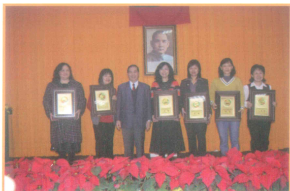
頒贈獎牌予 2009 年地方料理競賽冠亞季軍