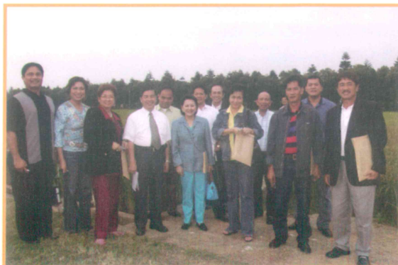
2005年11月10日接待菲律賓眾議員參訪