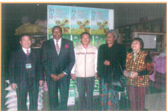
2005年1月12日接待馬拉威外賓參訪