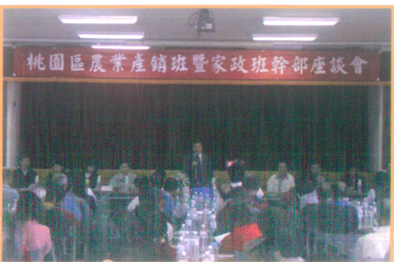
2004 年農業產銷班暨家政班幹部座談會