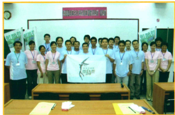
2006 年鄭場長與漂鳥藍鵲營第一梯次學員合影