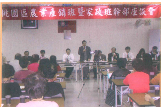
2005 年農業產銷班暨家政班幹部座談會