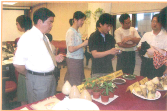
2005年6月3日記者會介紹本場研發新技術及產品