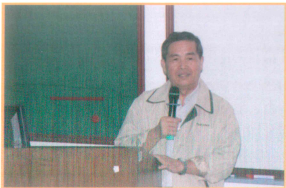
2009 年農民專業訓練鄭場長上課情形