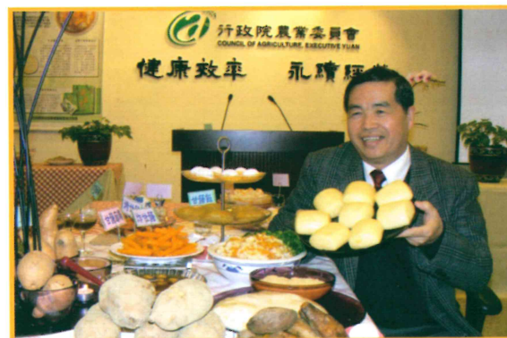
2009年1月7日召開甘藷金寶桃園3號記者會