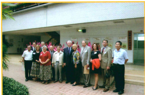
2010年6月14日接待美國中西部 議長與議員參訪