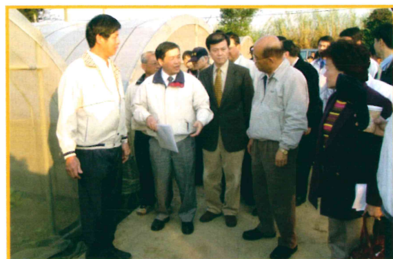
2007年2月4日陪同蘇院長貞昌視察八德市蔬菜產銷班第3班