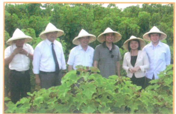
2009年8月4日陪同張立委嘉郡視察業務