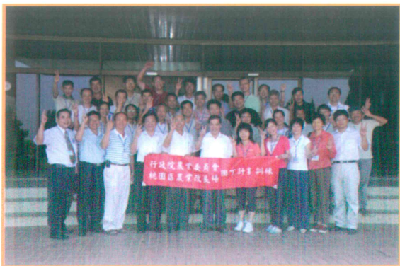
2009 年鄭場長與園丁學員合照情形