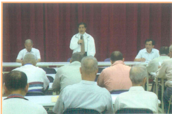
2009 年本場技術諮詢講習會