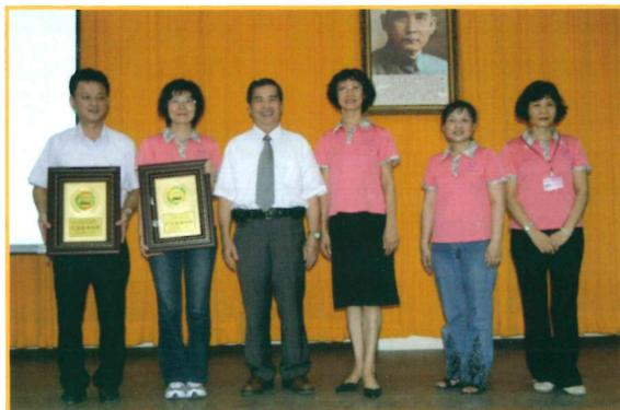
2010 年地方料理成果展頒獎