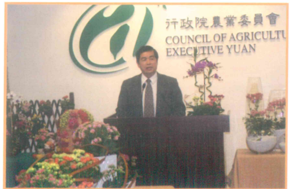
2007年3月15日召開長壽花品種記者會