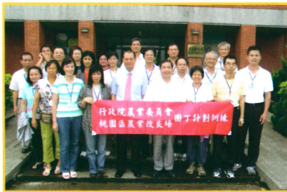
2007 年鄭場長與園丁計畫訓練班員合影