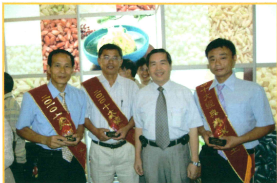
鄭場長與 2010 年十大經典好米得獎者合影