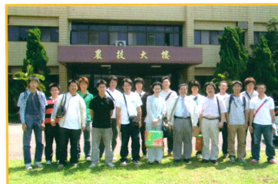
2006年9月26日接待日本團參訪