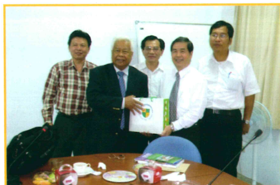
2009年10月16日接待汶萊國會 議員參訪