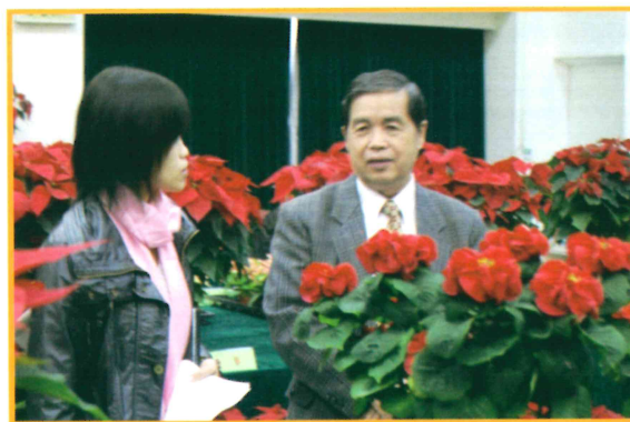
2009年12月2日高品質聖誕紅盆花評鑑鄭場長接受記者訪問