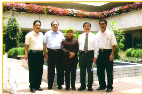
2007年5月1日接待印尼外賓參 訪