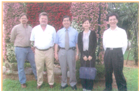
2006年5月25日接待國合會外賓參訪