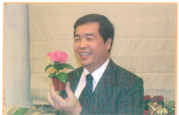
2004年12月8日記者會介紹小品聖誕紅