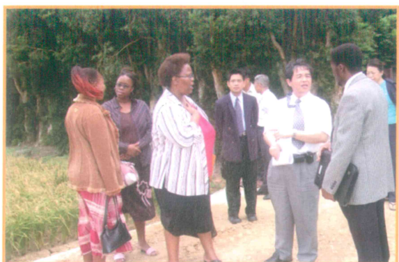
2005年6月23日接待史瓦濟蘭外賓參訪