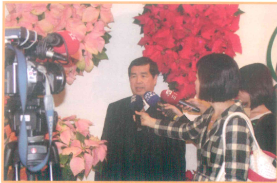
2007年12月20日召開聖誕紅記者會