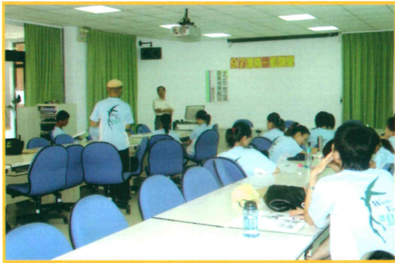
2008 年漂鳥藍鵲營上課情形