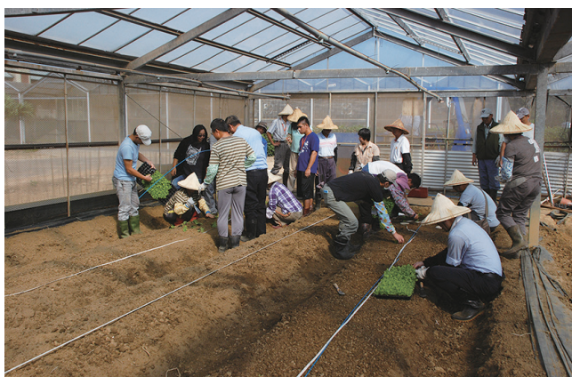
蔬菜栽培研習班田間實習