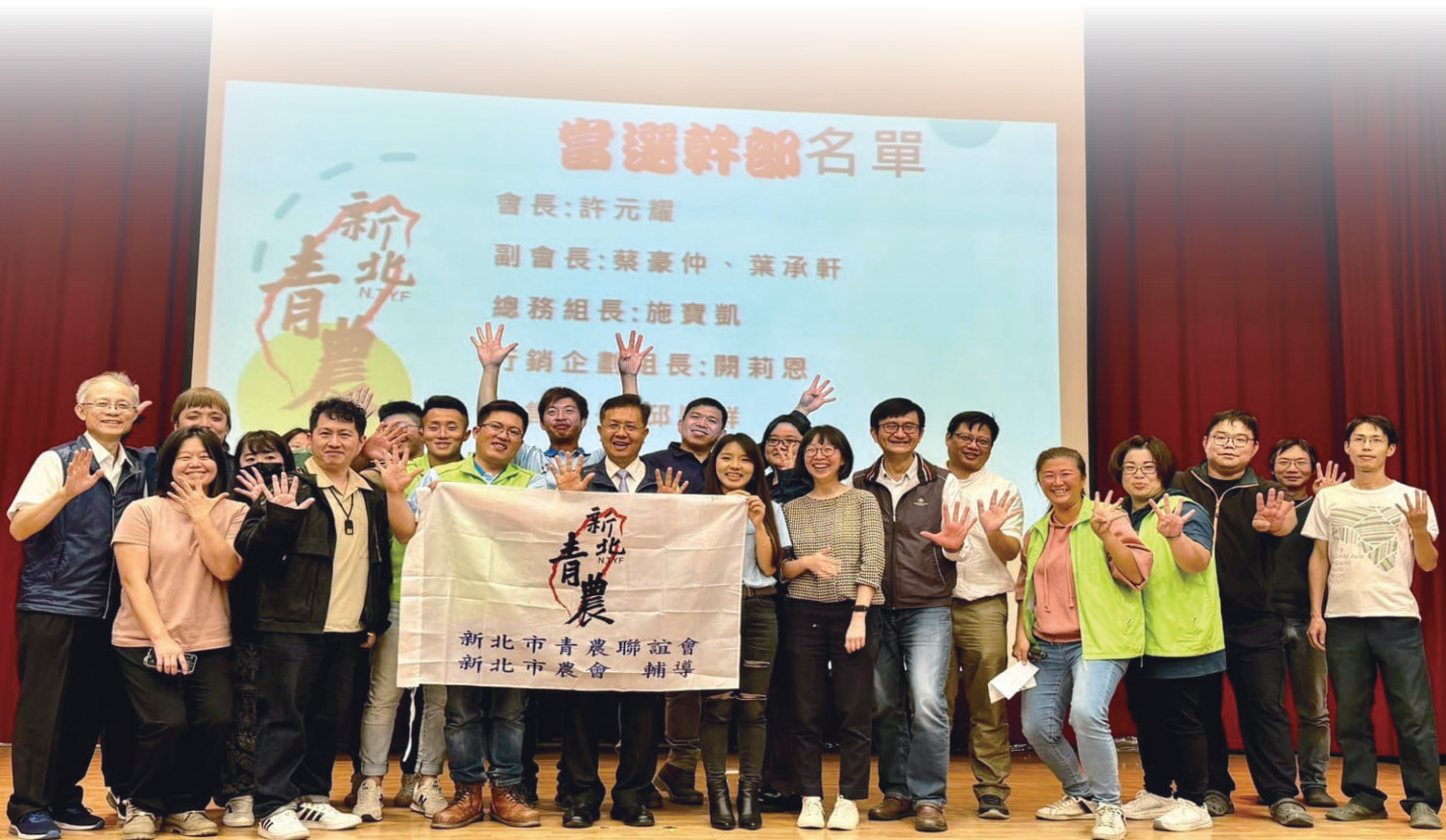
新北市青農聯誼會第 4 屆及第 5 屆幹部與長官來賓們合影