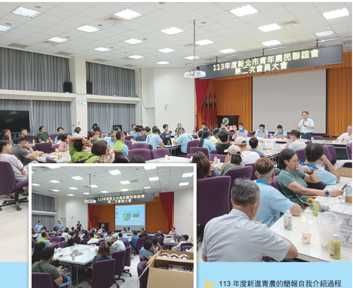
🌿 113 年度新進青農的簡報自我介紹過程