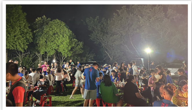
112 年桃園中秋烤肉聯歡晚會活動現場