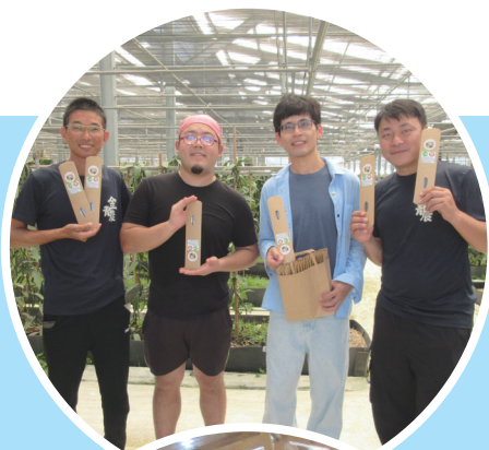
本場與三合院香草園共同將有機香草莢贈與金門縣青農