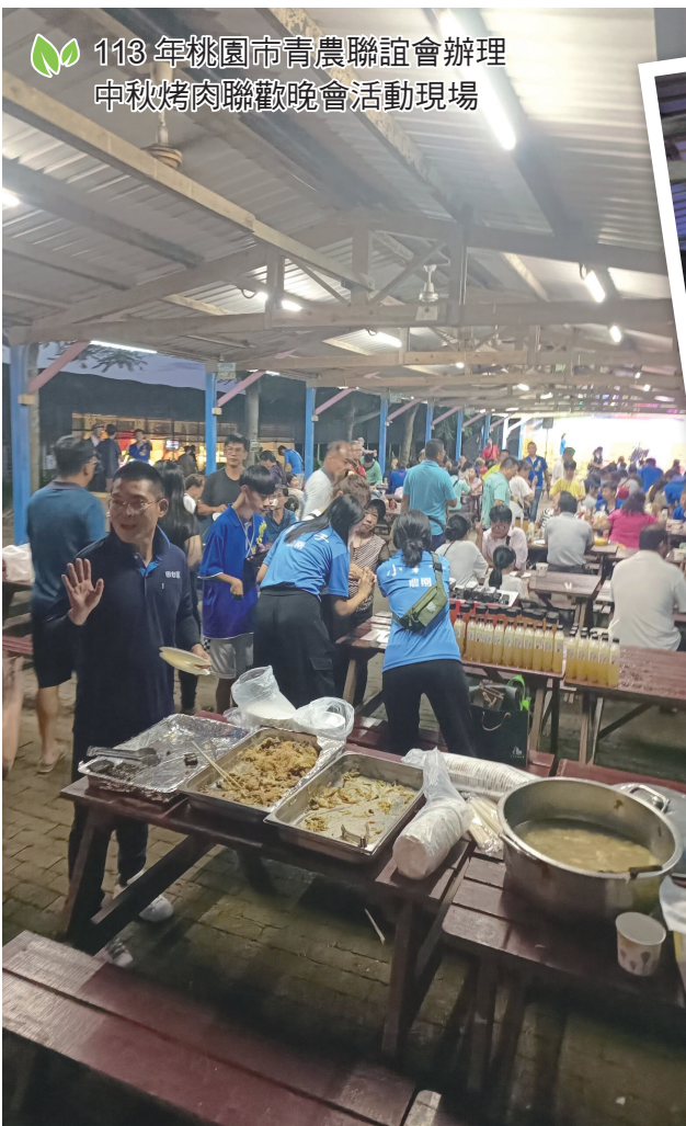
113 年桃園市青農聯誼會辦理 中秋烤肉聯歡晚會活動現場