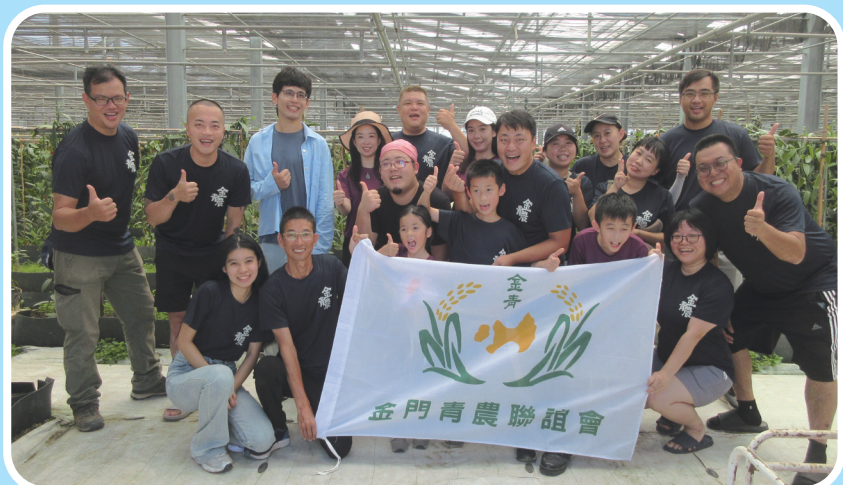
金門縣青農聯誼會觀摩桃園市新屋區三合院香草園