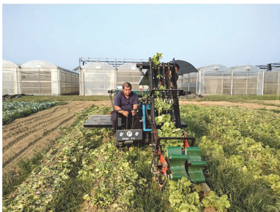
圖 4、結球萵苣採收作業

結球蔬菜採收機包括：採收機組、揚升輸送機組、處理作業平台、底盤。作業時履帶行走於畦面上，每次採收一畦 2 行，如圖 4、5。由於採收部偏在機台左側，因此採收時需以逆時針方向繞行採收。萵苣機械採收後輸送至處理平台，人工在作業平台上直接精揀合格品棄置不良品及外包葉，可改善後續分及包裝效率。未來可在作業平台上增設遮陽裝置及座椅能大幅改善作業辛勞度。