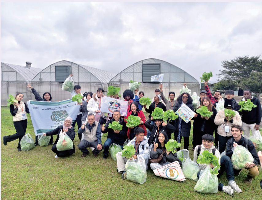
▲圖5.從田間到餐桌，讓國內外學生親身感受農業的價值與樂趣。