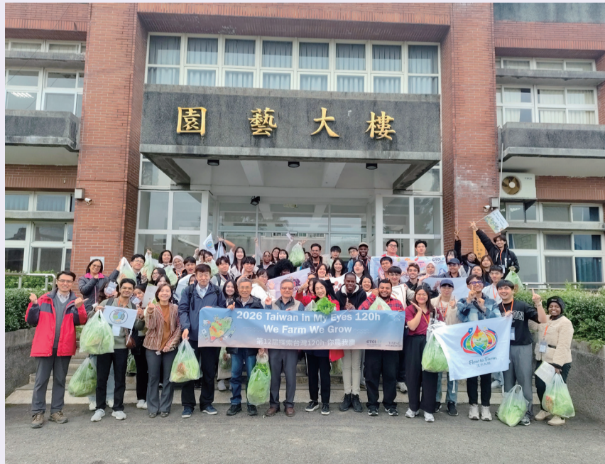
▲圖6.期待這次交流能在年輕世代心中種下永續與友善農業的種子。