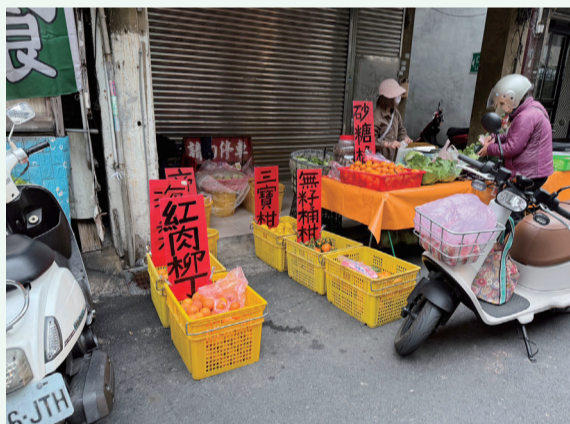
▲圖 1. 隨著近年持續推廣，「三寶柑」在市場上逐漸嶄露頭角，並受到消費者關注及肯定。

無論應用於夏日清涼飲品，或冬日暖心烘焙，都可以讓「三寶柑」的美味展開一場跨越四季的「延長賽」！目前有計畫性規模種植「三寶柑」地區為新竹縣寶山鄉，栽培面積仍持續擴大中。想品嚐這份來自《柑橘界小清新》的獨特滋味，歡迎逕洽寶香柑桔集貨場（電話：03-5585833）。