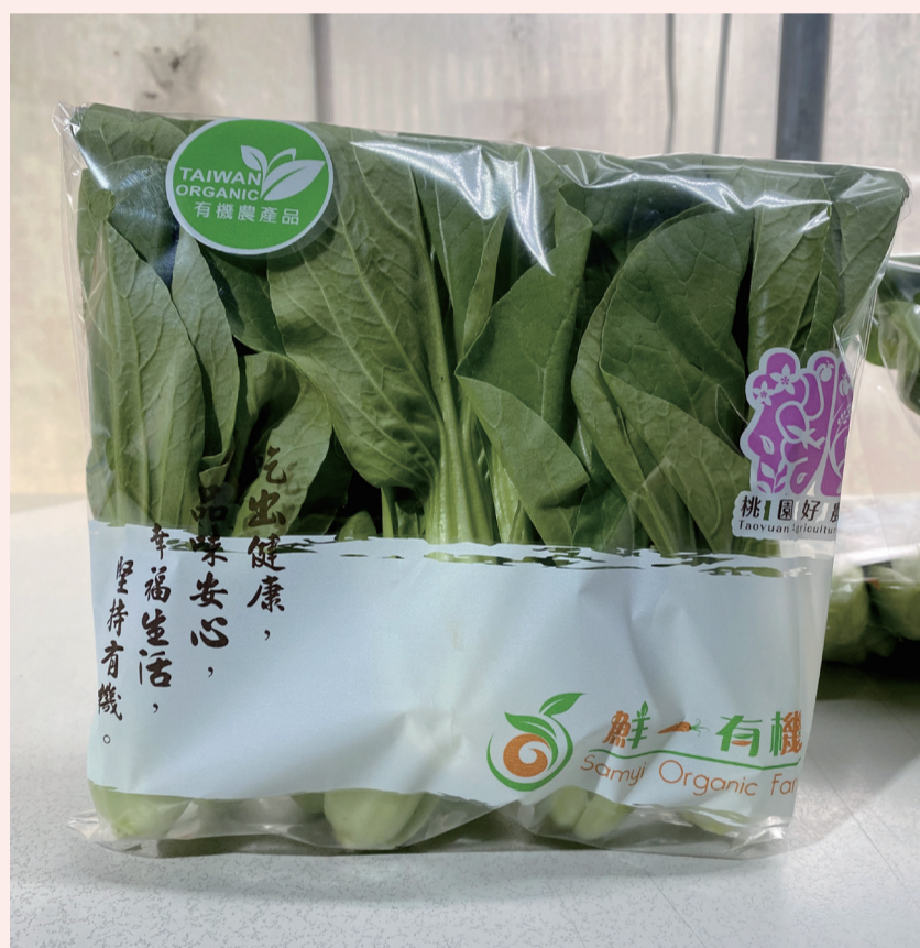
▲圖 2. 目標產品 -250 克小包裝青江菜。

產品「碳足跡」盤查不僅是為產品貼上標籤，更重要的是協助農民「看見」生產流程中的改善機會。透過優化冷鏈設備與田間肥培管理，不僅能降低生產成本，還能向市場提供碳排資訊透明的優質蔬菜，讓消費者在餐桌上也能輕鬆為環境永續盡一份心力。