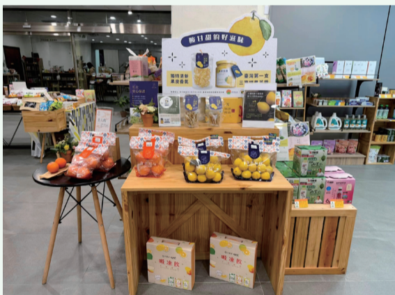
▲圖 2. 「三寶柑」加工後風味依舊清新，為適合加工之柑橘品種。