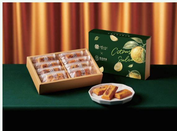
▲圖 3. 「三寶柑」果皮糖及果茶醬的加工技術可以讓「三寶柑」的美味~延長賽，延續一整年。