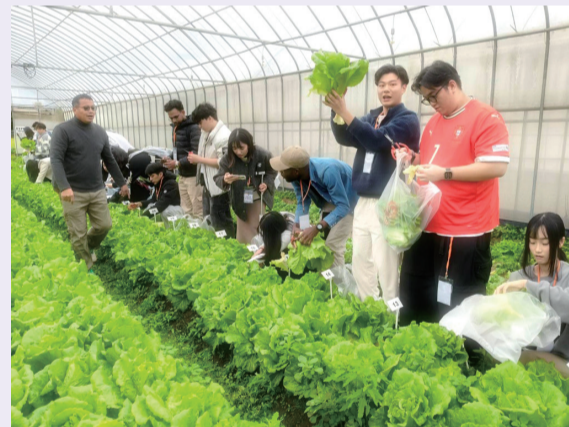
▲圖4.食農教育體驗時刻，同學們對於碩大的萵苣感到十分驚訝。