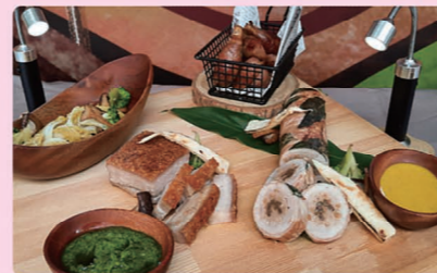
▲經國管理暨健康學院 - 扮豬吃老虎隊，以原住民風味脆皮豬及豬肉波隆庭和手工帶骨香腸完美呈現，勇奪全國總決賽專業組冠軍。