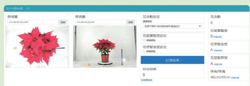
▲聖誕紅盆花品質分級影像辨識系統操作介面。