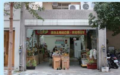
▲位於新竹縣竹北市的店面 - 不二農產直販所。