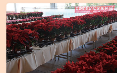
▲109年高品質聖誕紅盆花評鑑會場。