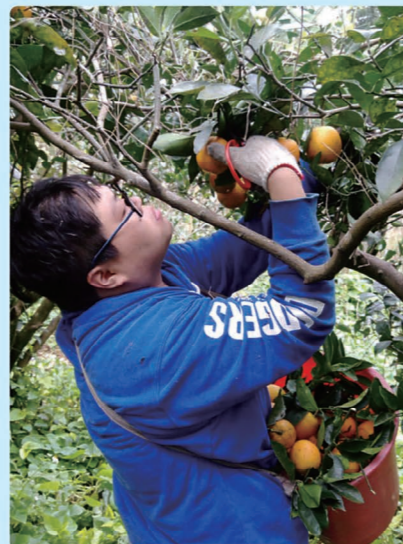
▲宇真正在修剪果樹。