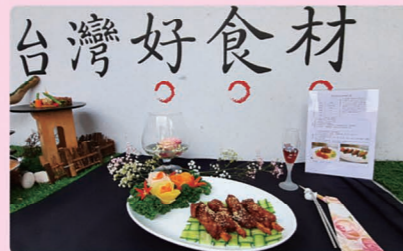
▲本場輔導轄區之桃園區農會家政班以「戀」- 豬排骨創意料理榮獲業餘組第3名。