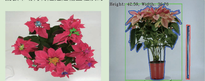
▲聖誕紅俯視影像可供辨識花序數量、花面圓整度及花序緊密度。

聖誕紅盆花品質分級影像辨識系統，僅需上傳兩張照片，搭配比例尺輔助，即可辨識出花朵數量、花面圓整度、花序緊密度及花莖整齊度等分級特徵，並計算出盆花產品高度與寬度等規格資訊，更可進一步依據市場與專家訂訂之品質分級標準，歸納顯現客觀一致之整體級數，提供買家參考。