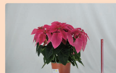
▲國立中興大學園藝系育成優良新品種「愛神」。