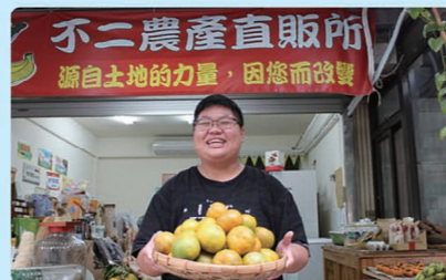
▲宇真捧著剛採收的柑橘。