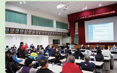
▲農友針對議題熱烈提問。