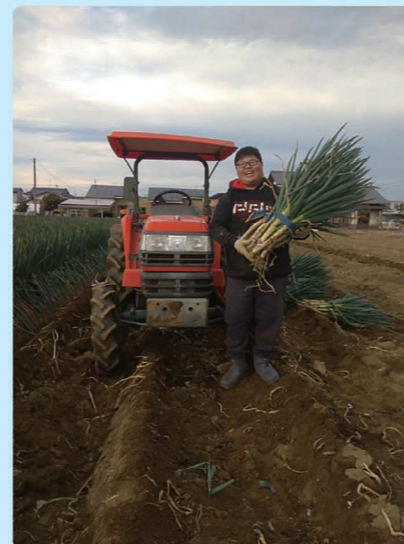
▲宇真開心地抱著剛採收的大蔥。