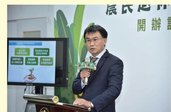
▲農委會陳吉仲主委說明農民退休儲金制度。

農委會強調，鼓勵青年農民提繳農退儲金，政府也將對等提繳金額，越早提存，提繳越多，日後退休也將領越多。依目前老農津貼每月7,550元，每4年依消費者物價指數(約4%)調整1次的設算條件，以及農退儲金設算條件(勞工每月基本工資24,000元、每年平均調升2%、基金收益3%、平均餘命20年、及農民提繳10%)，40歲提繳25年的農民，「老農津貼」加上「農退儲金」可月領2.4萬元；30歲提繳35年的農民可月領3.7萬元。