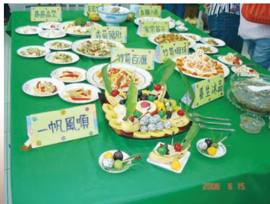
地方特色料理創意研發