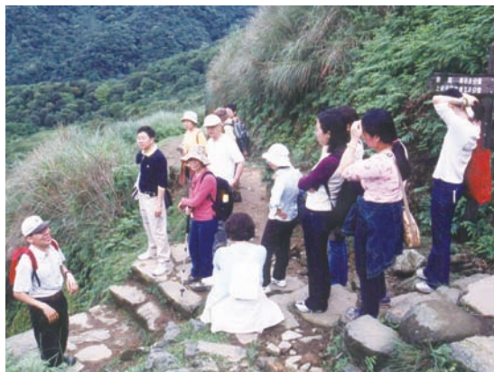
古道踏青及人文解說