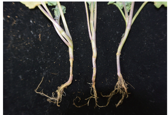
黃條葉蚤幼蟲啃食穴盤苗，造成根系短少