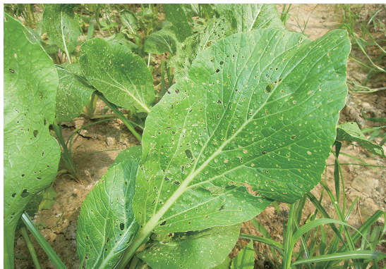
黃條葉蚤取食作物呈孔狀